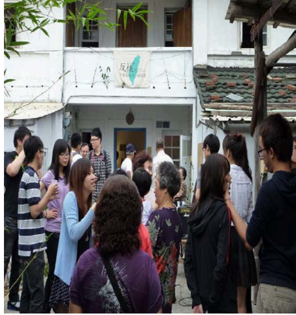
2. 在地居民在欣賞老照片時，邊從照片中尋找年輕的自己，邊和大家分享故事。