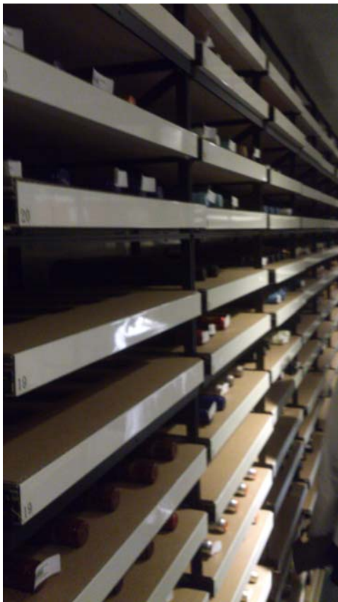
華藝數位股份有限公司的酒窖