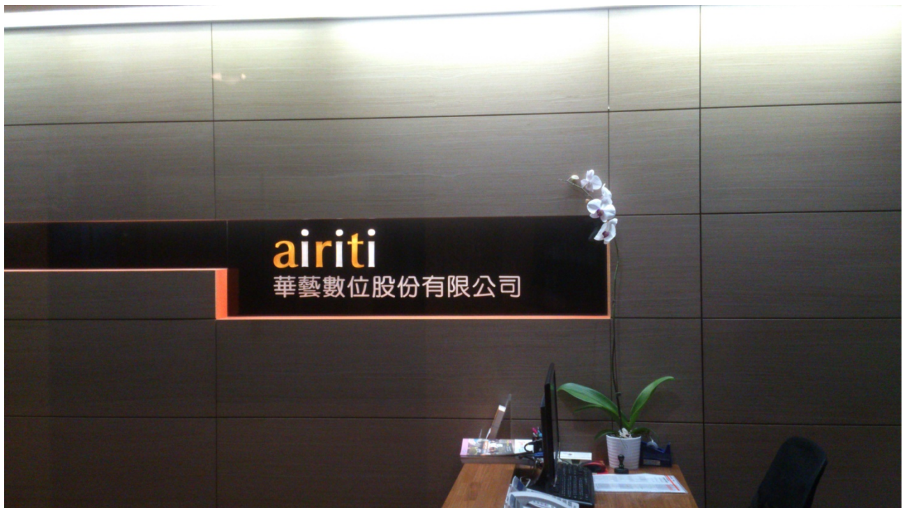
華藝數位股份有限公司的logo