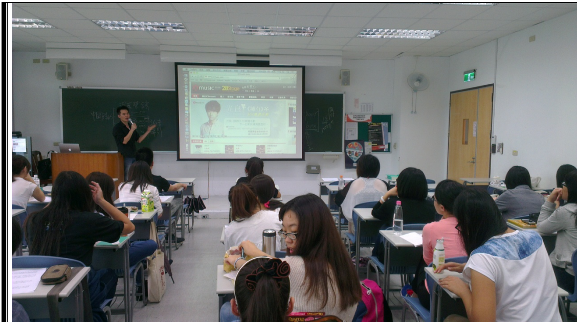
老師在說明星娛官網的功能