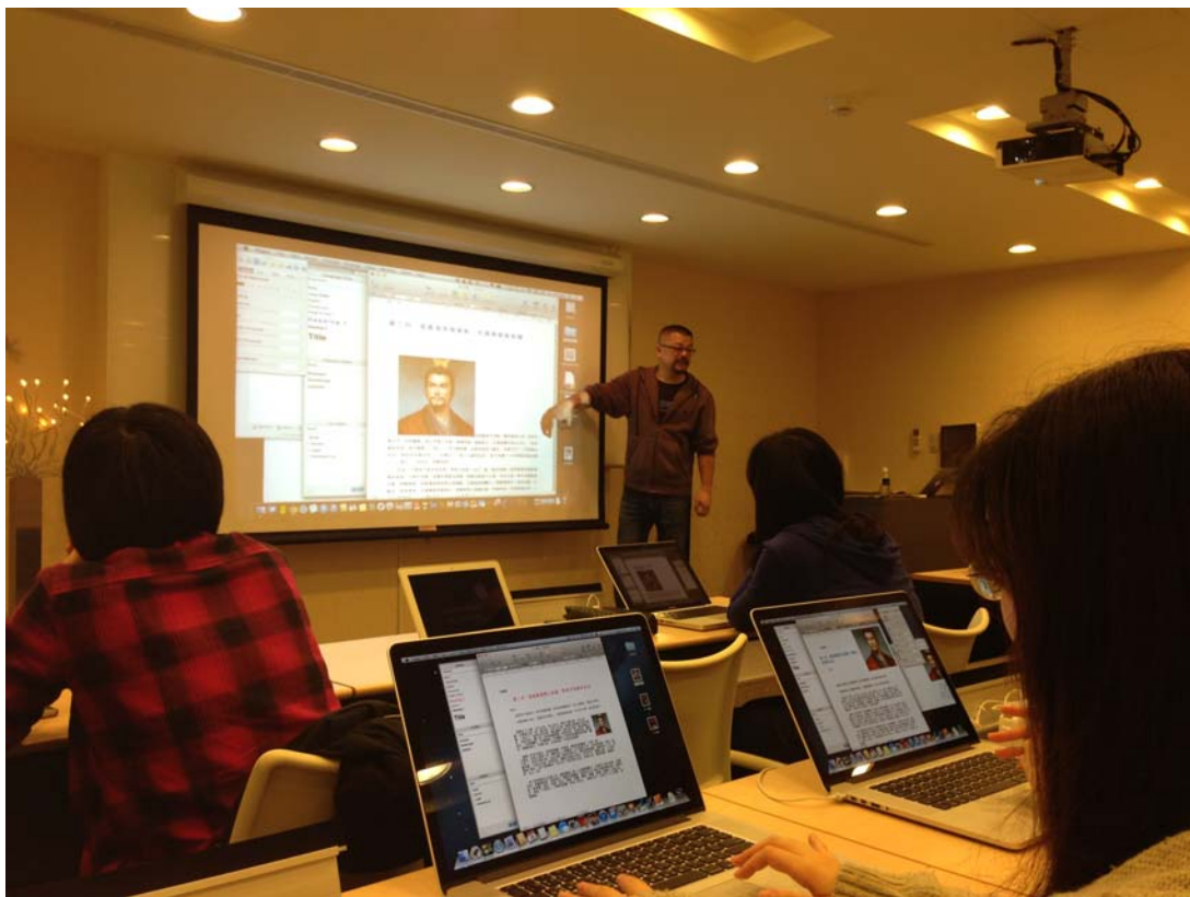
老師正在講解圖片插入與文字版面的流動。