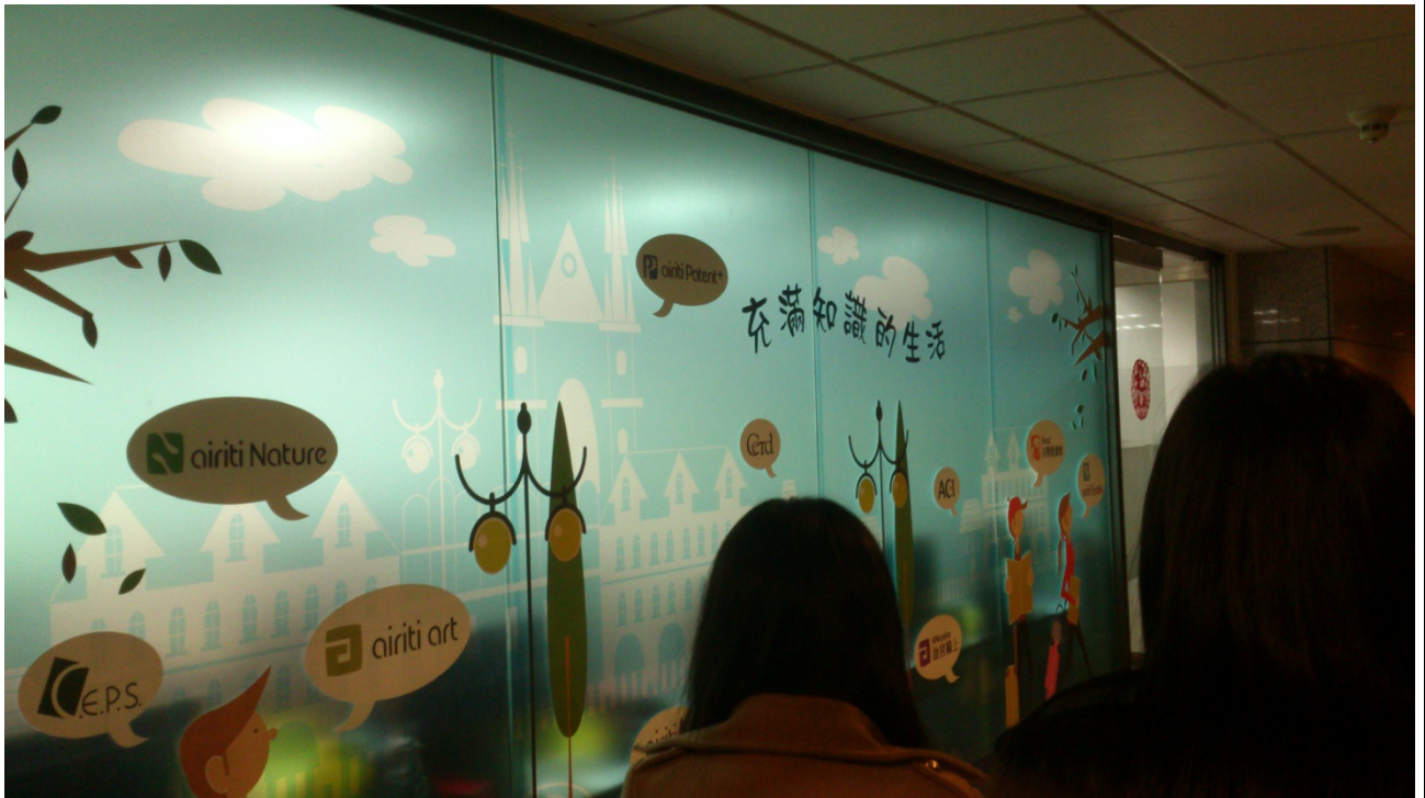
華藝數位股份有限公司的入口