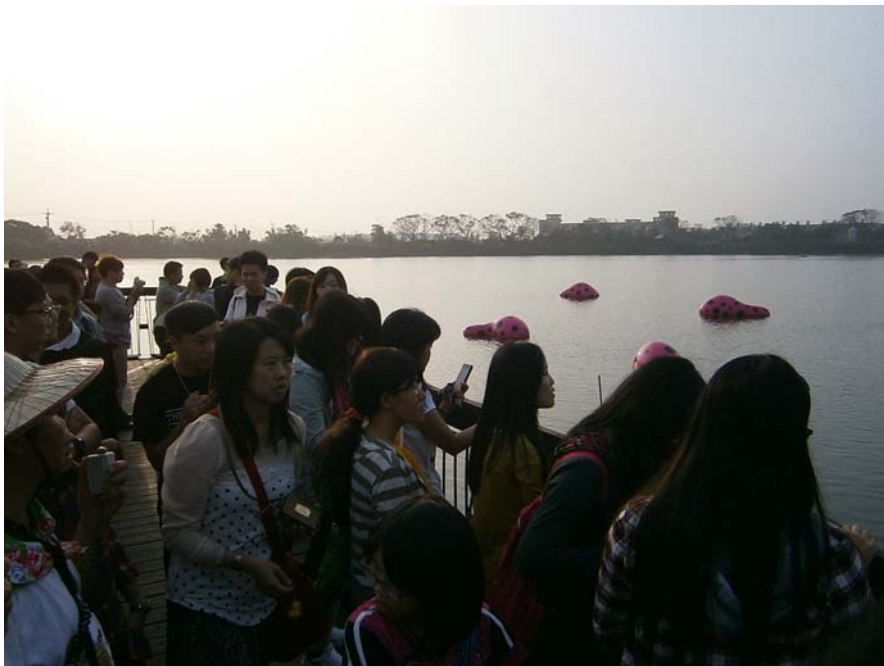
(同學在導覽人員介紹下，觀賞點點藝術跟池塘整合出特別的趣味)