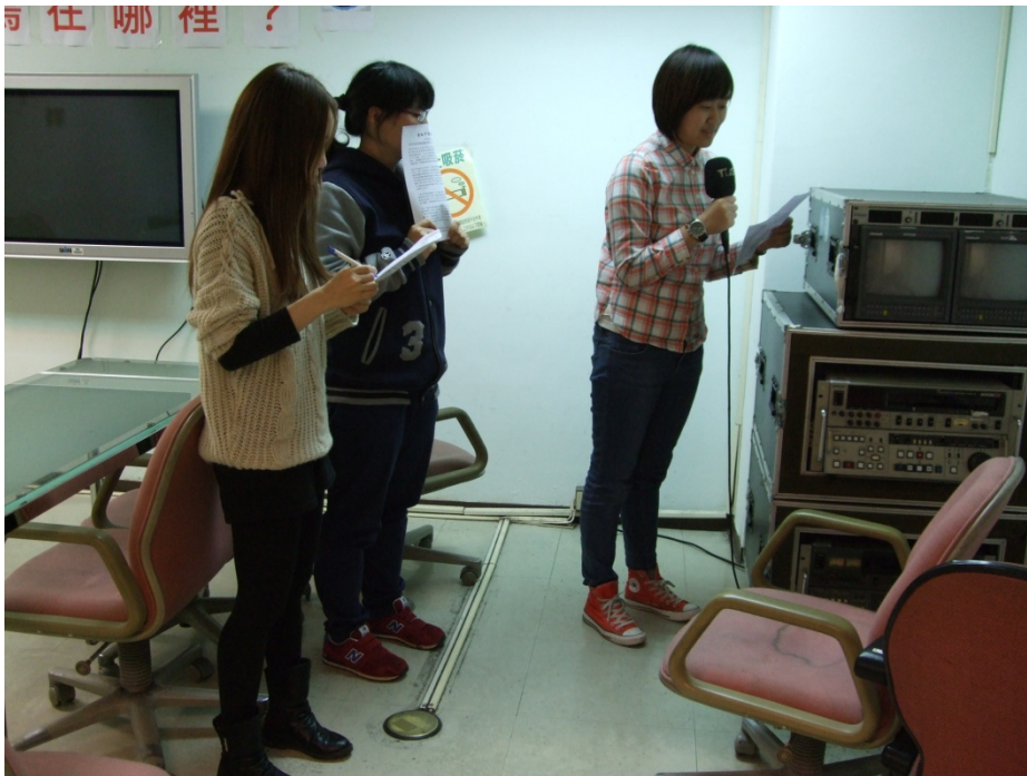
新聞播報過 音練習