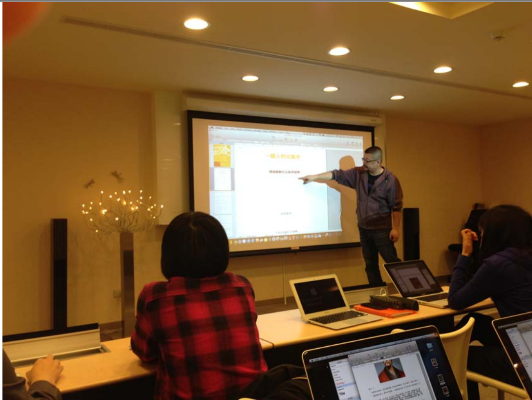
老師正在講解段落前後空距設計。