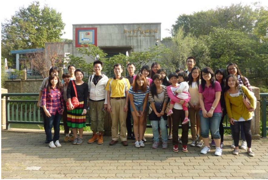
(主任與助教、同學在新竹玻璃工藝博物館外合照)