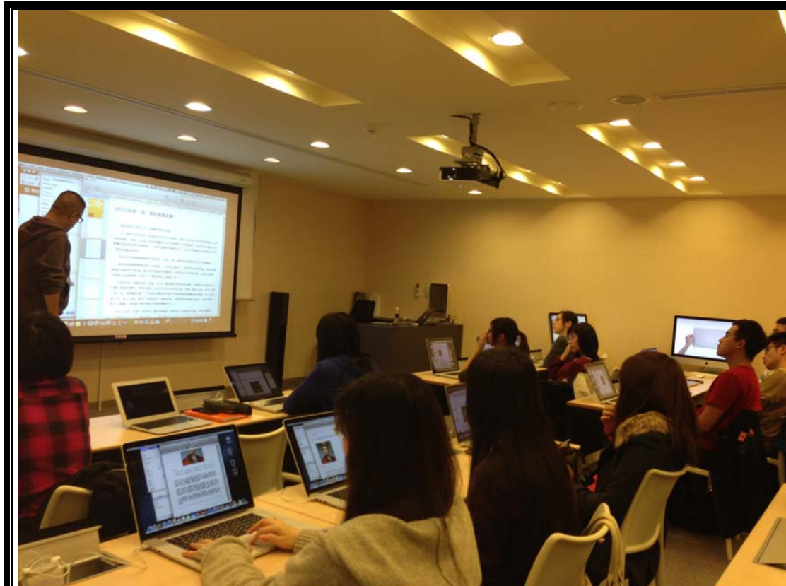
老師正在講解段式與字型設計。