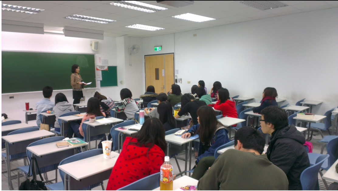
老師說明新聞摘要