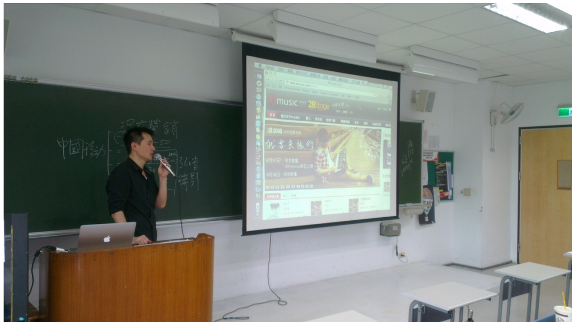
老師示範如何透過付費正當的下載歌曲