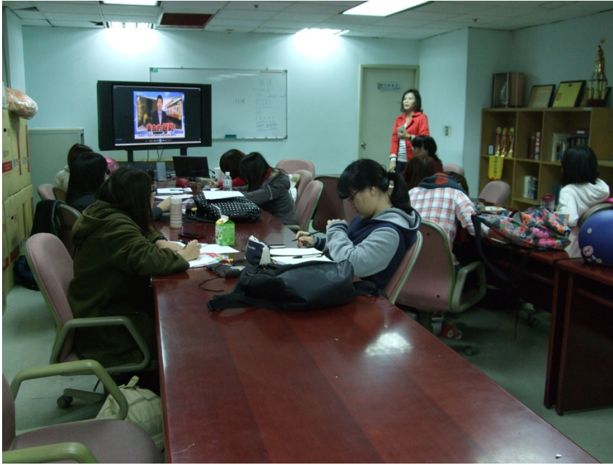
電視新聞稿 撰寫練習