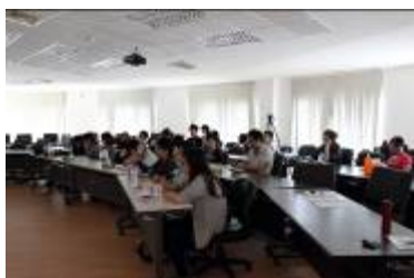
現場聽講的學生們