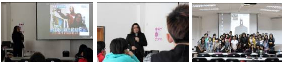
講座的講者就是新聞的主角