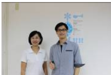
講者與計畫主持人合影