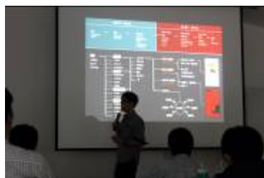
創意執行的步驟與可能