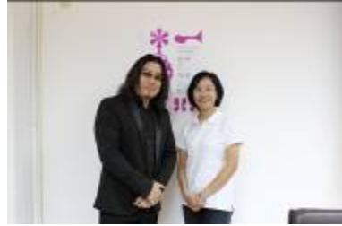
講者與計畫主持人合影