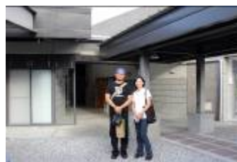
講者計畫主持人合影