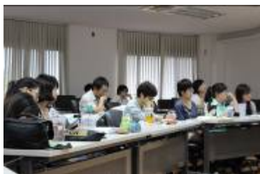
趕緊記下來精華內容