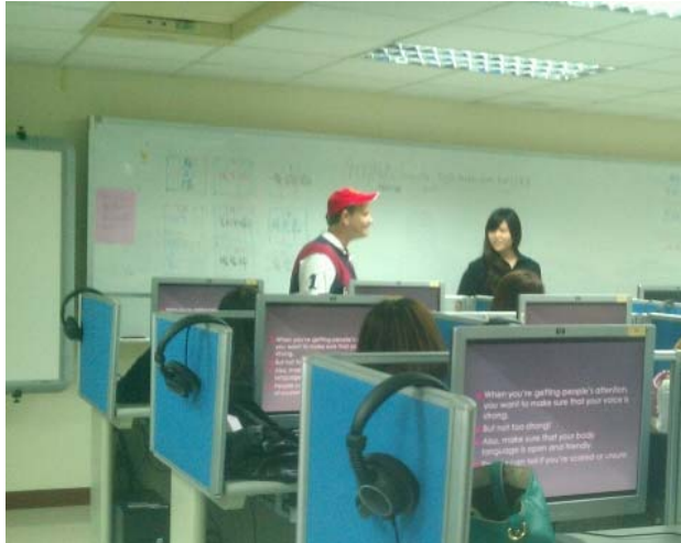
外籍老師利用PPT來讓學生學習銷售的技巧，並讓同學上台跟老師一起演練銷售情景。