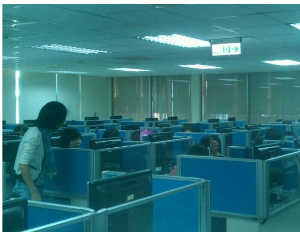
老師個別詢問同學是否對課堂有疑問。