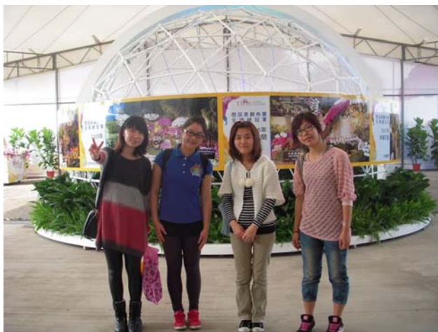
同學在展場的入口處合照記錄下難忘的回憶。