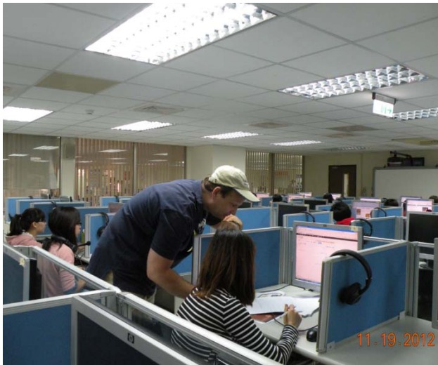
外籍老師針對學生提出的問題，有關蘭花專業名詞的發音來做加強訓練。