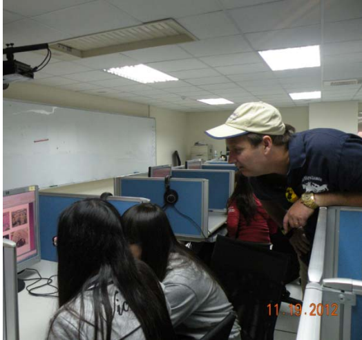
外籍老師讓學生分組討論報告內容，讓學生提出問題來討論。