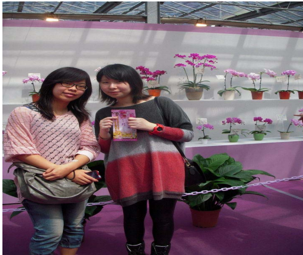
實際參觀展覽會廠中的蘭花盆栽與景觀布置的比賽作品。