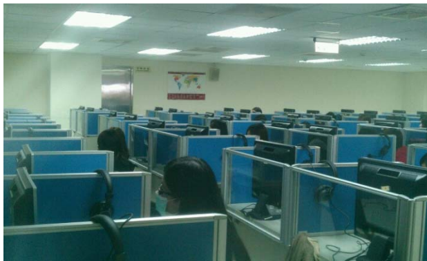
讓同學分組討論報告的內容。