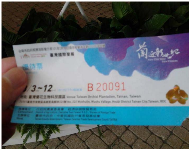
同學們台南國際蘭展的門票。