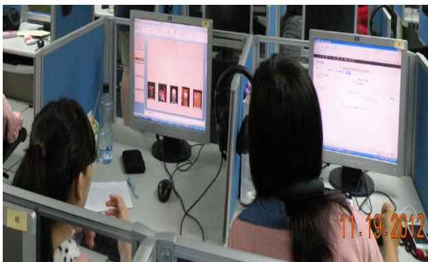
讓學生分組討論報告的內容，並蒐集與蘭花有關的資料。