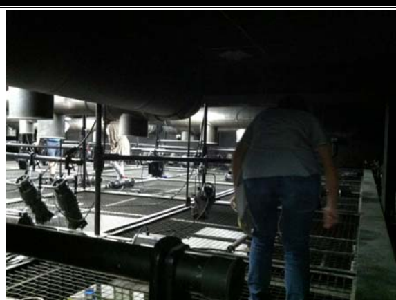
學生在黑盒子劇場鋼絲棚架（暱稱絲瓜棚）上，認識燈具。