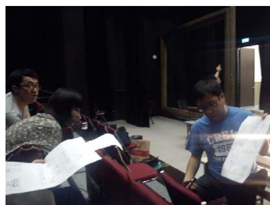
學生在黑盒子劇場裡學習看 light plot。