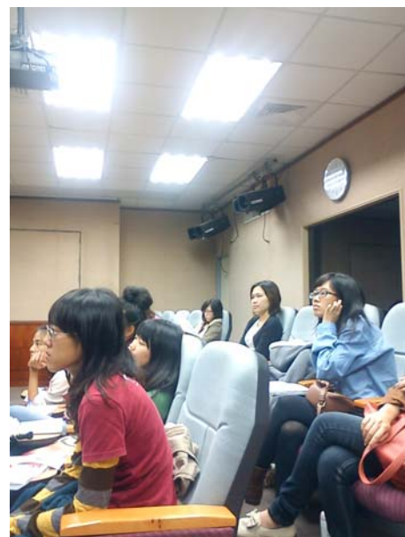
難得的燈光實務課程讓學生專注傾聽。 (11/09/2011)