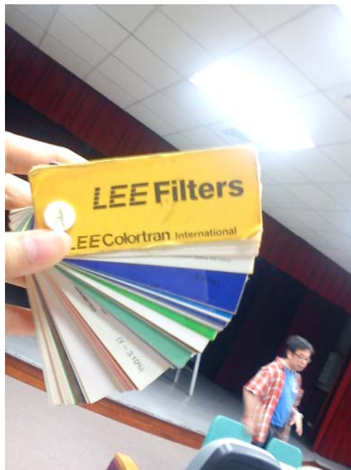
燈光魔術：色片介紹。(11/09/2011)