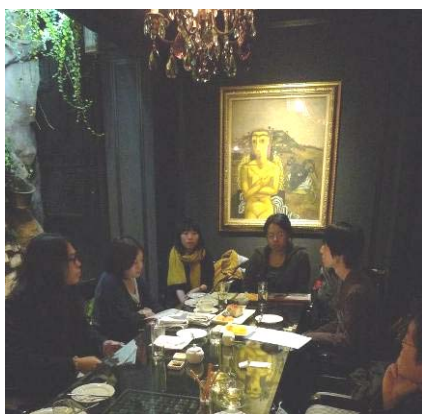
【圖4】《典藏今藝術》編輯團隊向修課學生講解平日工作分配。