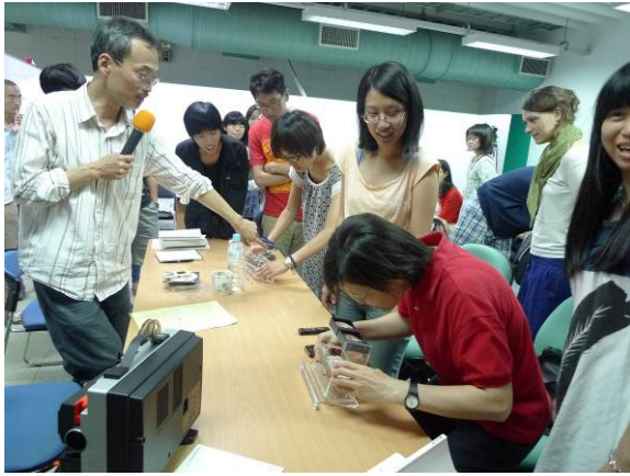
【圖1】修課學生現場操作高重黎的影像機器。