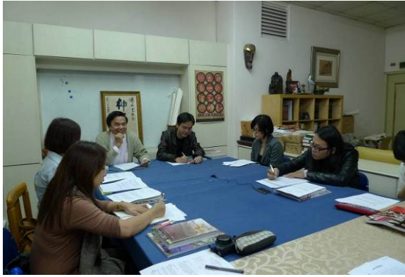
【圖1】臺北市徐州街《藝術家》雜誌社的地下室會議空間（課堂實況）。