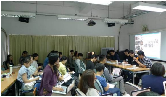
【圖1】2012年5月29日「蔣勳作為方法」座談會現場。