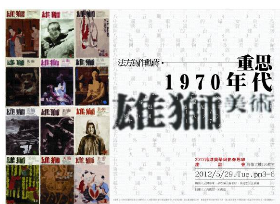
【圖4】「蔣勳作為方法」座談會海報。