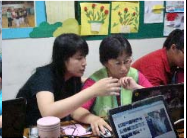
圖二：實習生認真的指導學員進度。