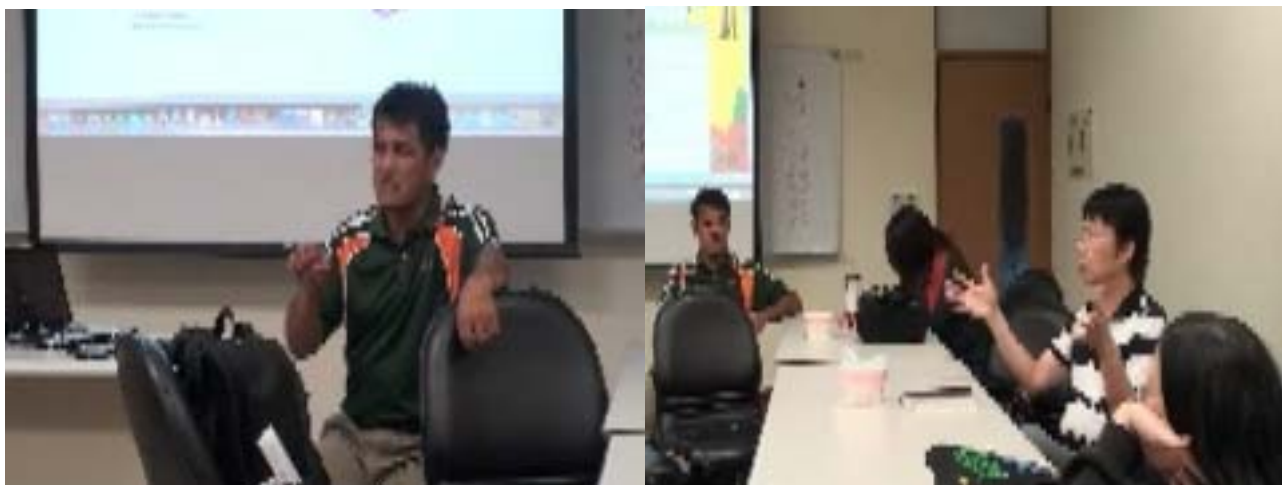
圖三：戴老師詳細的為同學說明部落的需求與狀況。