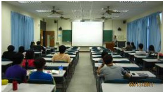
下課時同學的討論