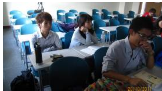
同學對於網路行銷的議題生疏，需要時間消化