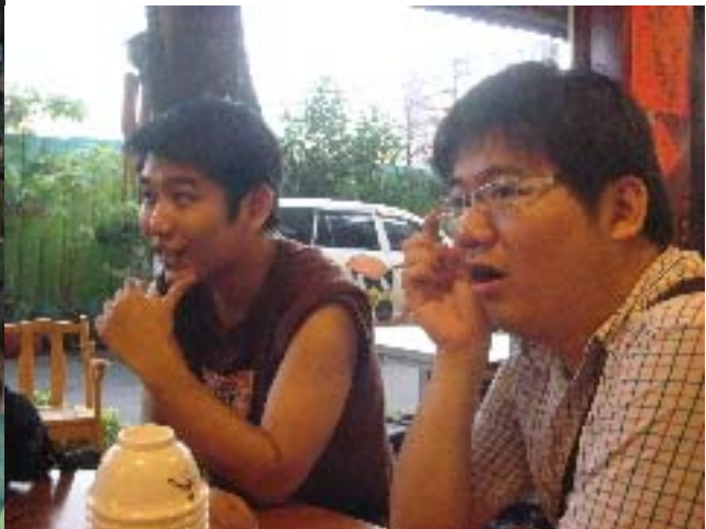
圖四：兩位指導老師於課程後與實習生談話及分享。