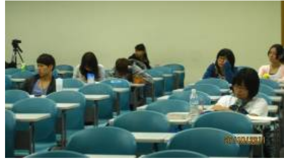
上課的學生認真做筆記