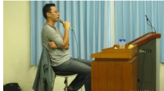
鄭老師回答同學的提問