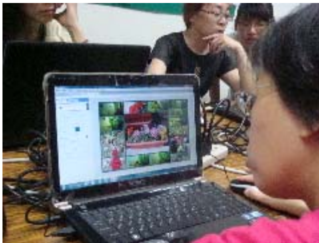
圖三：學員學習免費修圖軟體 PICASA。