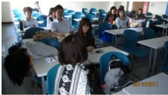
下課時同學的討論