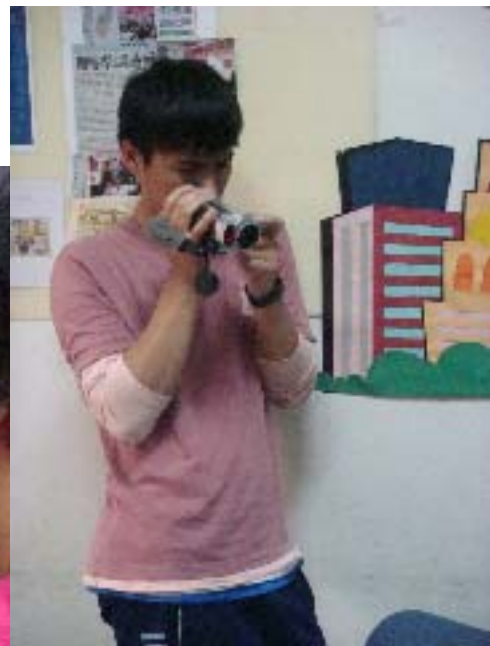
圖四：實習生把上課過程拍攝起來，帶回學校與其他同學討論。