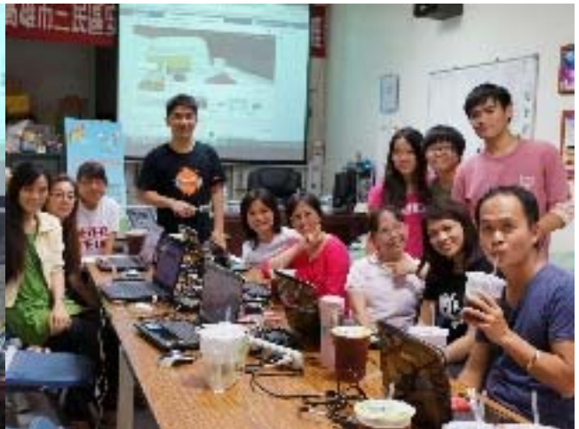
圖二：全體學員與實習生。