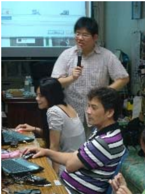
圖三：社區發展協會理事長也參與課程行列