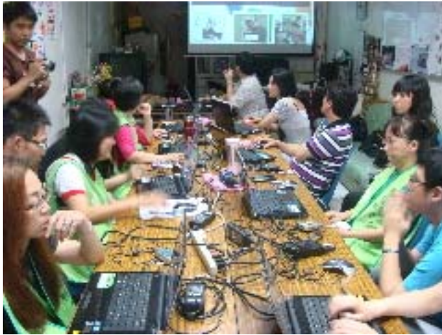
圖一：全體學員與實習生。