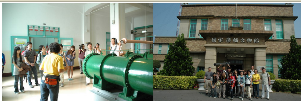
參訪國家廣播文物館，聽志工解說其歷史，並於大門口合影。