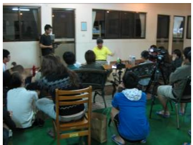
課程時間：參訪結束後的晚上，老師為本日的參訪跟同學們分享心得