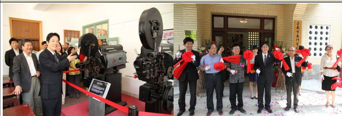
開幕時，台南市市長賴清得、本校校長及貴賓蒞臨剪採