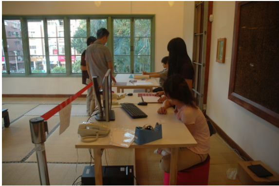
學生加緊趕工製作告示牌及路線圖