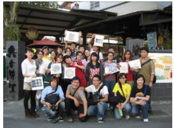
透過造紙的手動操作，學生們對紙的感觸有另一種想像及啟發