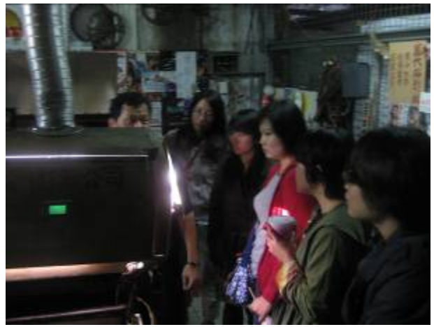
台中萬代福戲院的東家對於電影資料庫的收藏不遺餘力