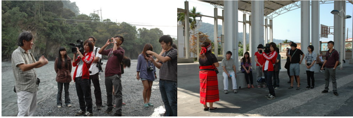
井迎瑞老師解說當年沙鷺之鐘原住民與日本軍之間的關係，以及請當地原住民解說餘生館的歷史。