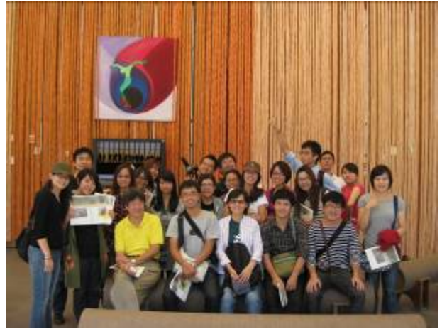
埔里紙教堂是另一種媒材形式轉換的呈現，也呈現紙的韌性