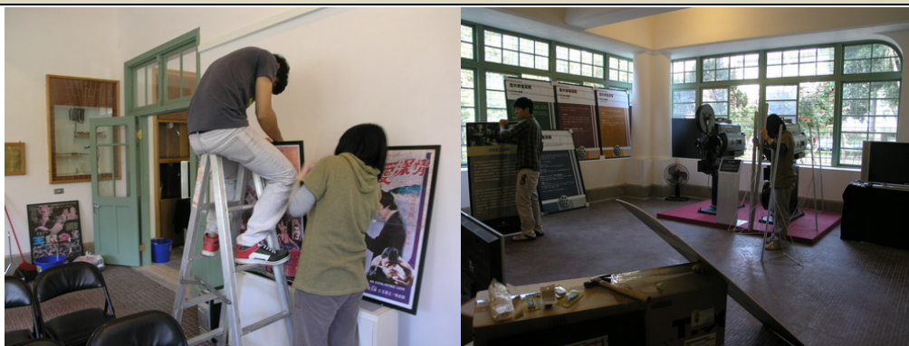
試營運期間實習場所－臺南市南門電影書院佈置現場