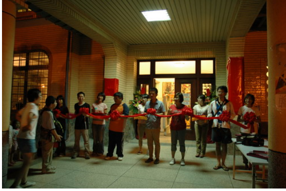
開幕前一晚學生採排剪採流程及儀式