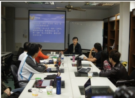
講師講授上課內容