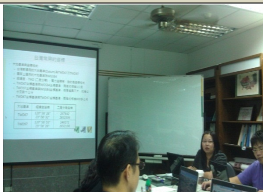
講師教導上課內容