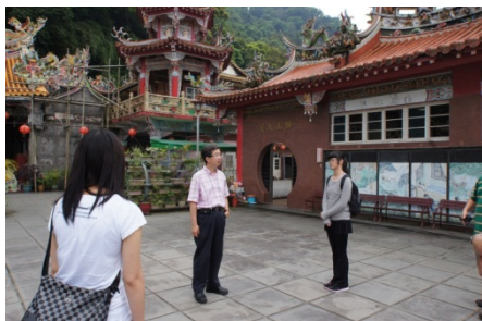
老師與同學們進行討論-輔天宮