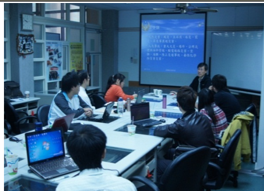
講師與同學熱烈討論