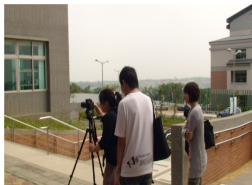
同學實作全景拍攝