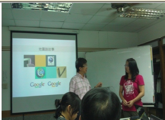
介紹講師與今日上課內容