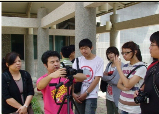
講師說明全景拍攝步驟