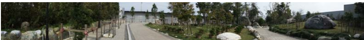
大興善寺拍全景圖