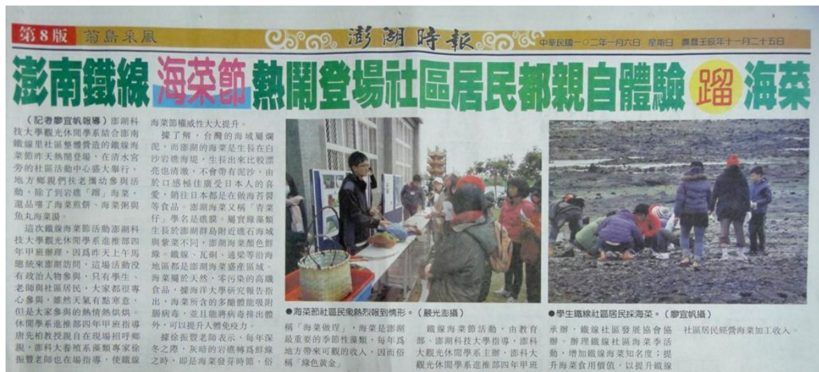
【圖 62】20130106 澎湖時報報導鐵線海菜節現況與內容，另地方電視台也以地方新聞電視報導，讓澎湖居民共同參與社區活動。