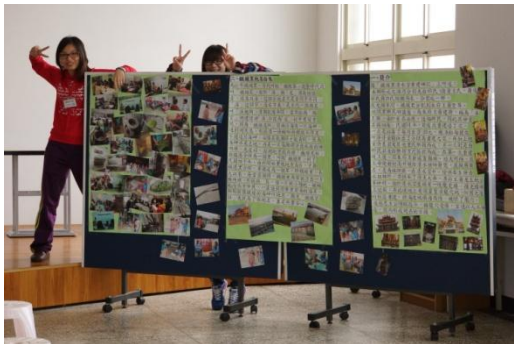
【圖50】採訪組同學將社區訪談成果彙整成平面海報與動態影像，分享給參與者，並適當的進行說明。