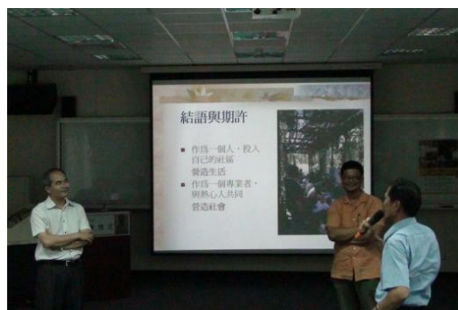
【圖18】南寮社區村長邀請曾老師至社區參訪給予社區未來發展建議。