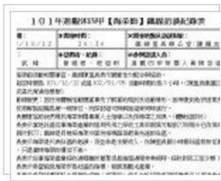
10月12日鐵線陳里長訪談內容 2 張相片