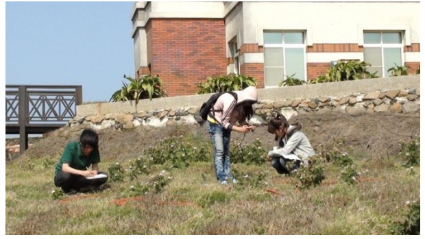
【圖 39】植物樣區調查，一組約為三人，拍照、採標本、記錄，依照分工來進行樣區的調查工作。