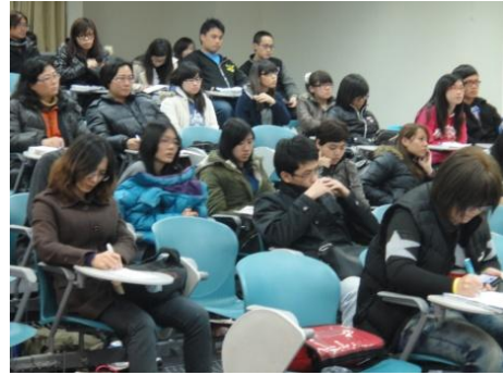
【圖12】校外與會人士包含公務人員、社規師、國高小教室及參與社區工作者。