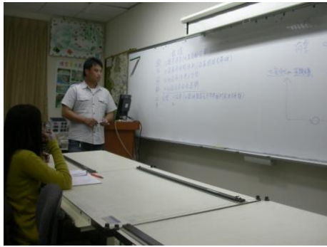
【圖31】同學將社區調查結果條列記錄白板，以腦力激盪方式討論社區觀光發展目標與議題。