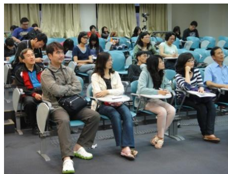
【圖16】聽者含民代. 村長. 教師. 社規師。