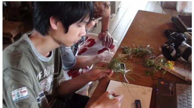
【圖 41】將樣線、樣區採集的植物，做種類確認的工作。