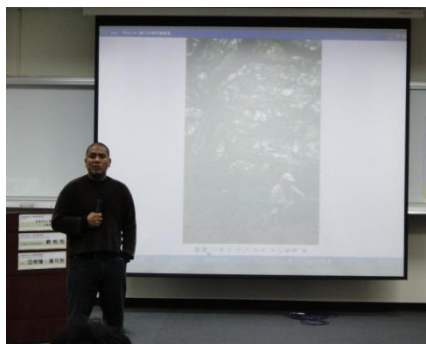
【圖19】撒可努老師以自身於部落成長的生活經驗，透過說故事的方式與同學分享。