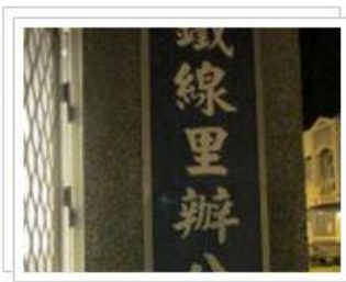
2012.10.12 首次拜訪里長之相談甚歡篇 102 張相片