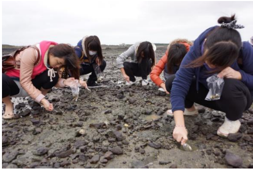
【圖48】參與者在體驗組同學的帶領下，至潮間帶進行採集工作。