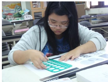
【圖28】同學運用繪圖工具進行製圖練習。