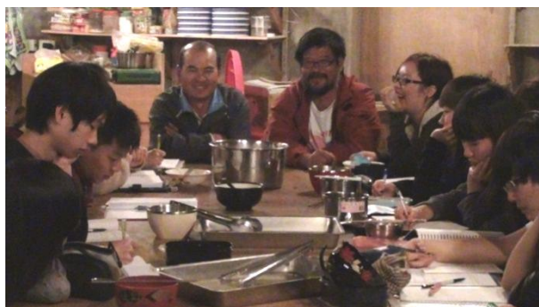
【圖34】村長與同學分享村落的歷史脈絡與人文故事，讓學生了解聚落的發展與思考未來的展望。