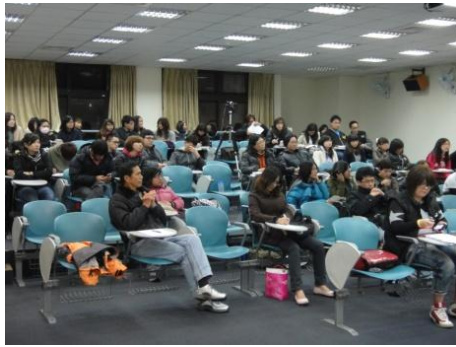
【圖13】參與講座包含學生、社區夥伴、社區規劃師、公務人員等對此議題有興趣之人。