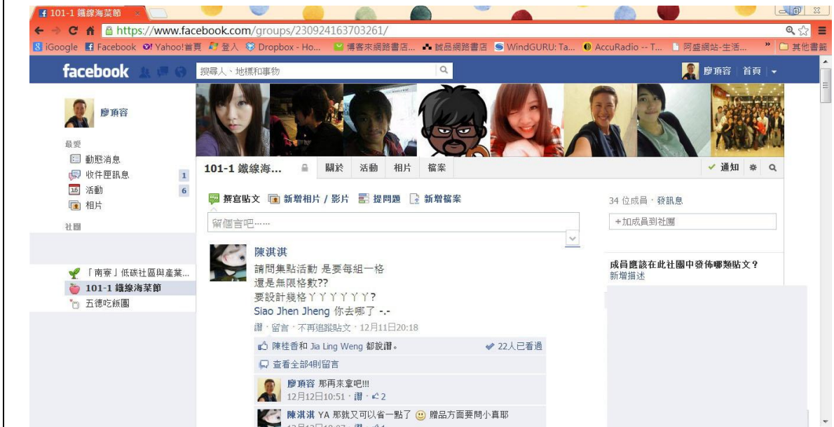
【圖 57】同學自行開設 facebook 社團討論區，進行社區參與等課程相關討論。