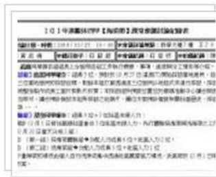
2012年10月25課堂會議紀錄 2 張相片