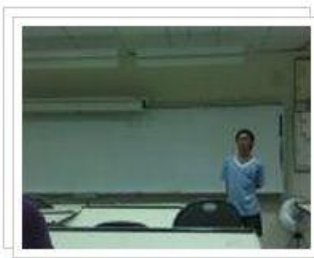
2012.09.22 會議紀錄照片-01 40 張相片