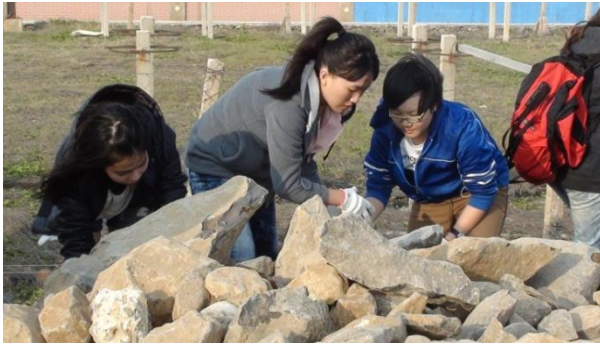
【圖 38】與七美土水老師傅學習菜宅推砌工法。