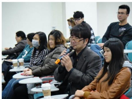
【圖23】同學提出於社區參與時所面臨的問題，請撒可努老師解惑。