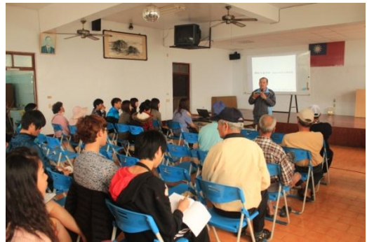
【圖 43】各組的設計提案、對策以簡報方式與居民透過社區成果發表會的形式，進行互動與分享。