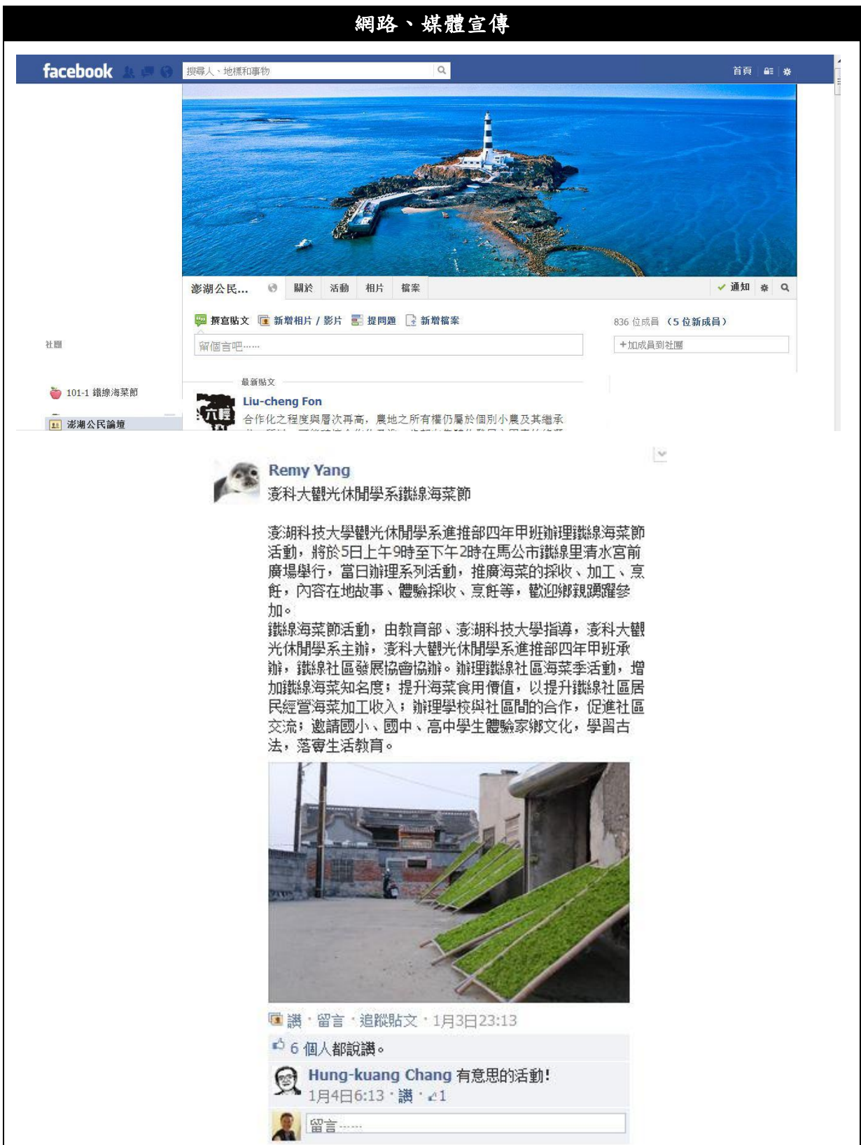
【圖 60】以網路宣傳、報紙宣傳專題講座及活動訊息，望以更多澎湖居民、社區夥伴參與課程，進行更多的討論與學習的機會。上圖為澎湖海洋公民論壇社團頁面，更有社區居民自主協助共同推廣、宣傳海菜節活動