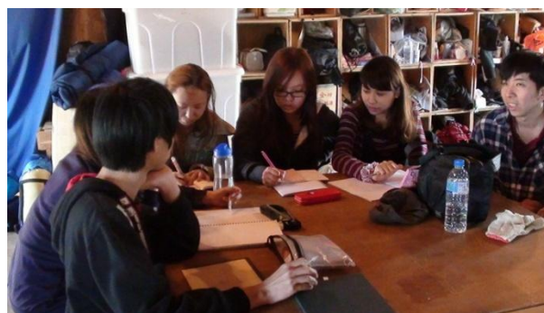
【圖37】同學分組討論未來操作之內容與工作項目。