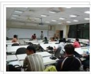
2012.10.18 會議紀錄照片-03 24 張相片