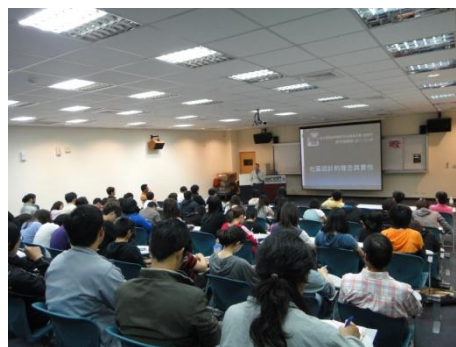
【圖6】參與講座同學與教師互動關係。