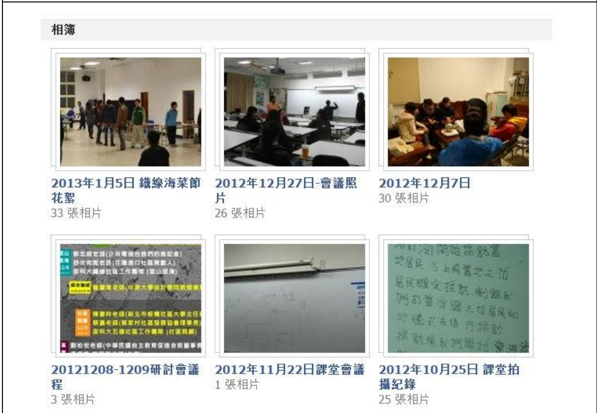
【圖 58】20121025-20130105 期間同學會議討論、研討會訊息發佈等資訊同步化與記錄。