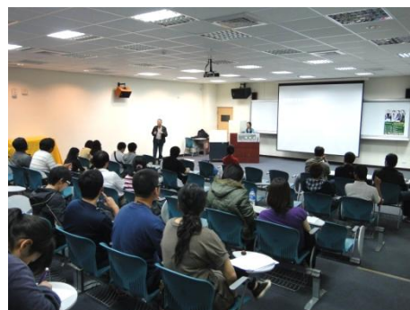
【圖10】演講完畢綜合討論與提問。