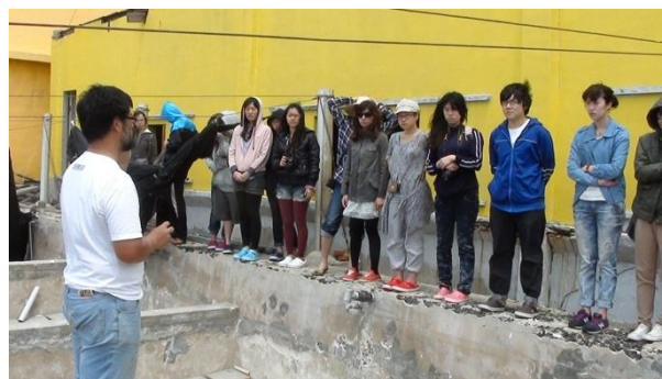
【圖35】唐老師帶領同學認識西海岸周邊九孔養殖池介紹與九孔養殖方法的認識。