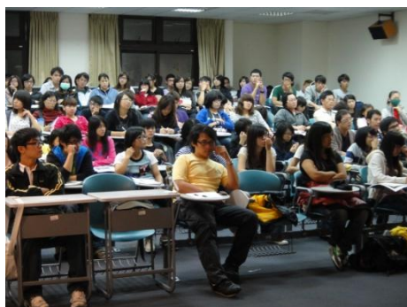
【圖5】校外與會人士包含公務人員、社規師、國高小教室及參與社區工作者。