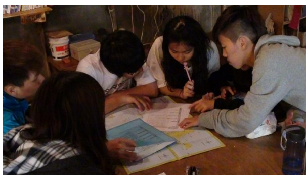
【圖36】同學分組討論未來操作之內容與工作項目。