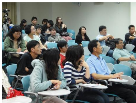
【圖17】參與講座同學與校外與會人士。