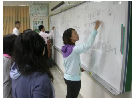
【圖32】同學透過白板進行調查記錄彙整與討論。