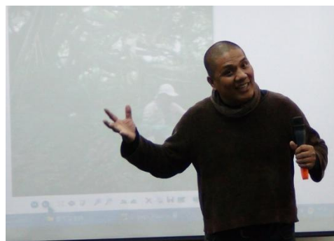
【圖20】撒可努老師從自身經驗中，開始著手實踐社區教育的過程與理念分享。