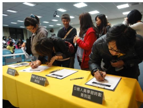
【圖2】參與講座包含學生、社區夥伴、社區規劃師、公務人員等對此議題有興趣之人。