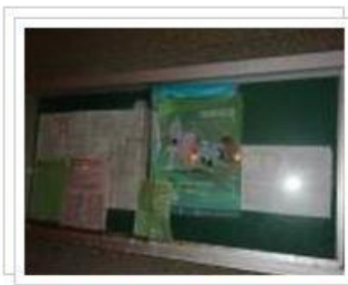
鐵線海菜節-活動場所週遭設施勘查 8 張相片