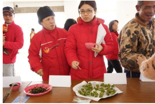
【圖49】美食組同學分別製作涼拌海菜、海菜粥、海菜丸、海菜煎餅，讓參與者試吃、嚐鮮海菜料理。