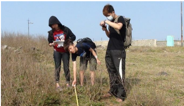
【圖 40】植物樣線調查，一組約三人，拉線、拍照、記錄。