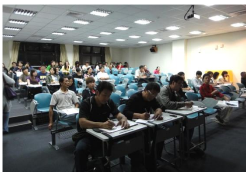
【圖9】參與講座同學與校外與會人士。