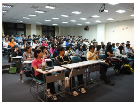
【圖4】參與講座同學與校外與會人士。