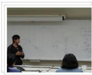
2012.10.04 會議紀錄照片-02 14 張相片