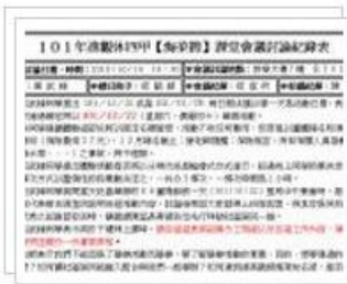
2012年10月18日 課堂會議紀錄 2 張相片