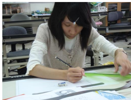
【圖30】運用繪圖工具進行製圖練習。