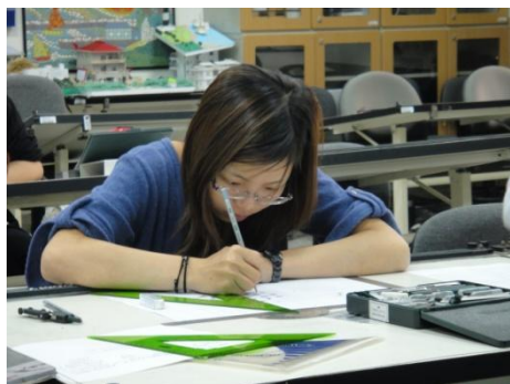
【圖29】運用繪圖工具進行製圖練習。