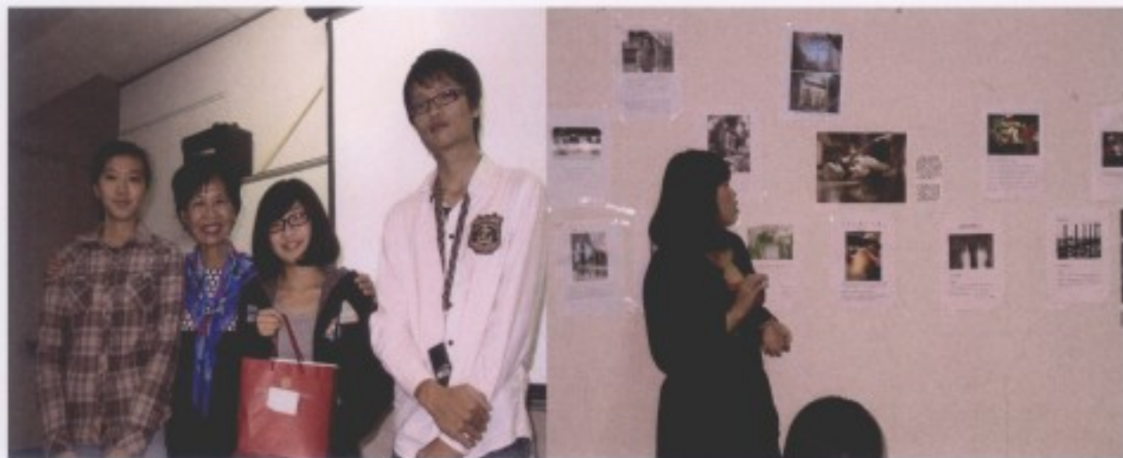
參加比賽者全體照

新移民多元文化家庭的創作比賽。選出各組全三名與佳作二名，頒獎留影。 創作比賽。選出各組全三名與佳作二名，得獎者感言分享。