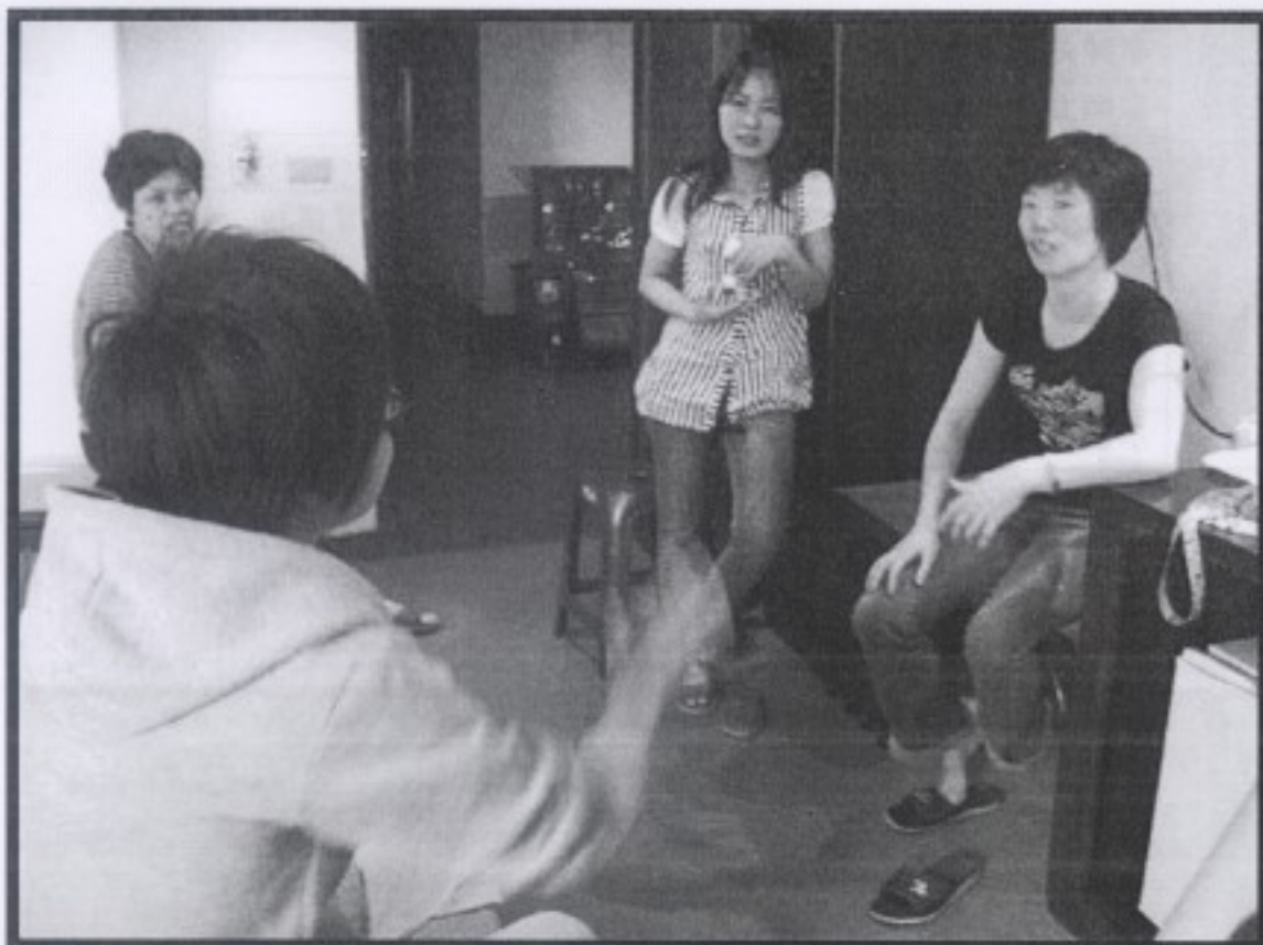
因為訪談者皆是在飯店工作，而訪談那天她們僅能空出午休時間，因此將訪談地點選在飯店