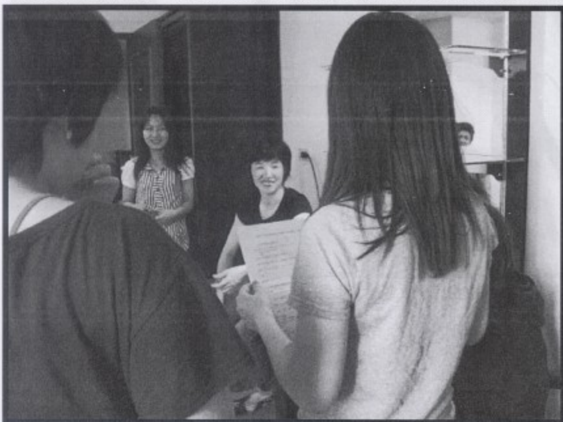
訪談當天是由劉淑娜紀錄、鄭詩潔攝影、洪筱倩錄音、陳巧芸及陳婷婷提問