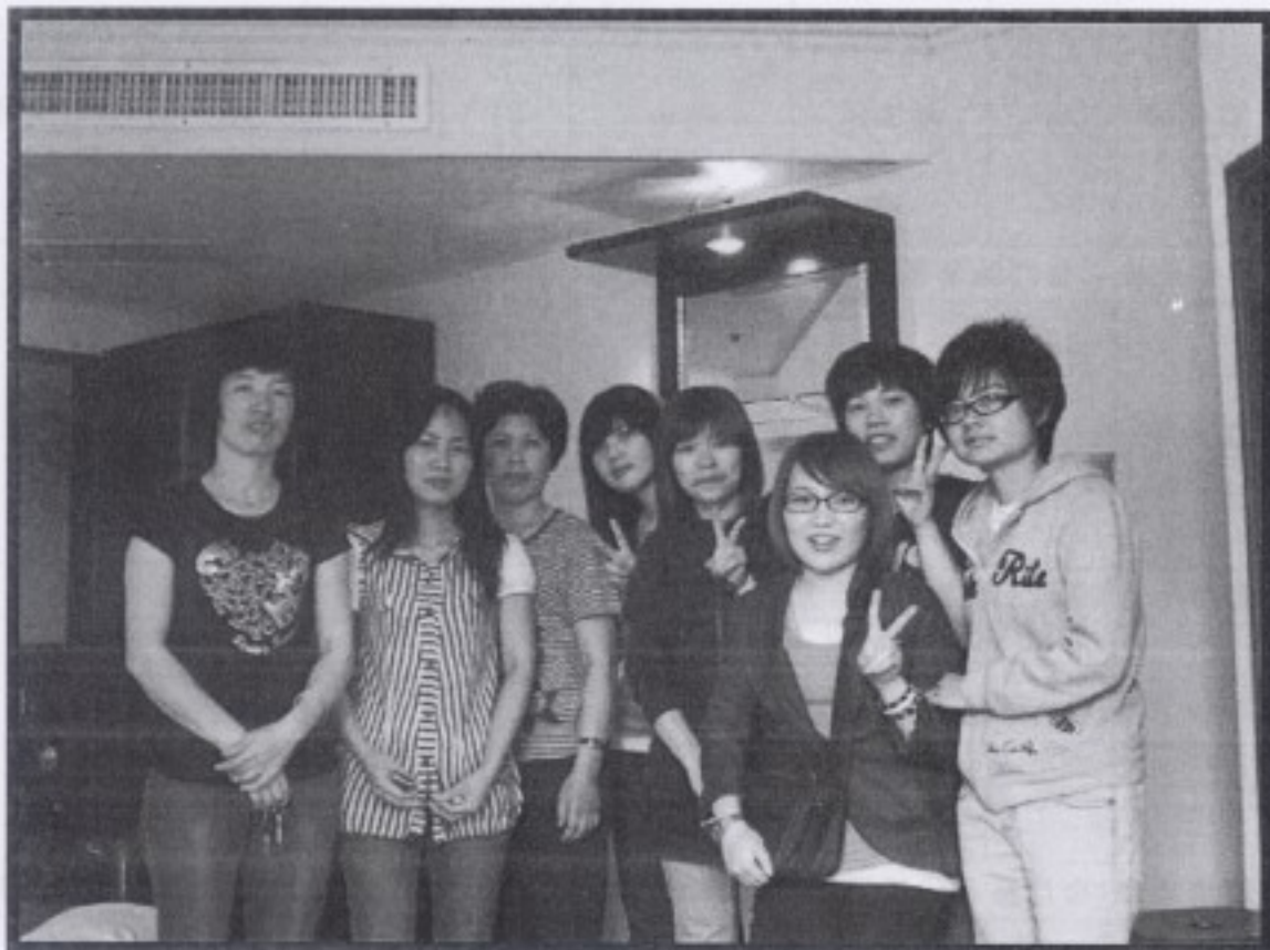
訪談結束後的大合照