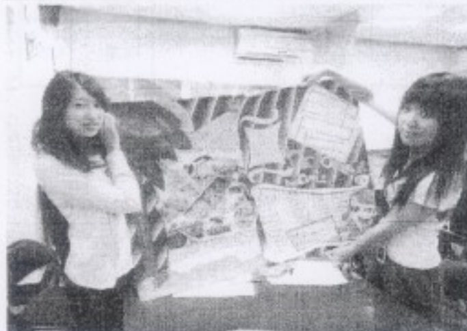
分組海報製作攝影。