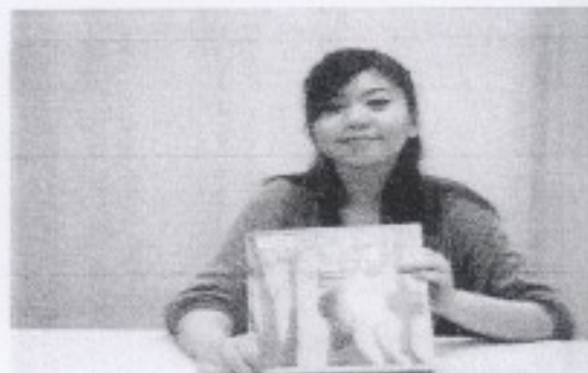
1.課前閱讀指定教材。2.樂於與同學分享成果。