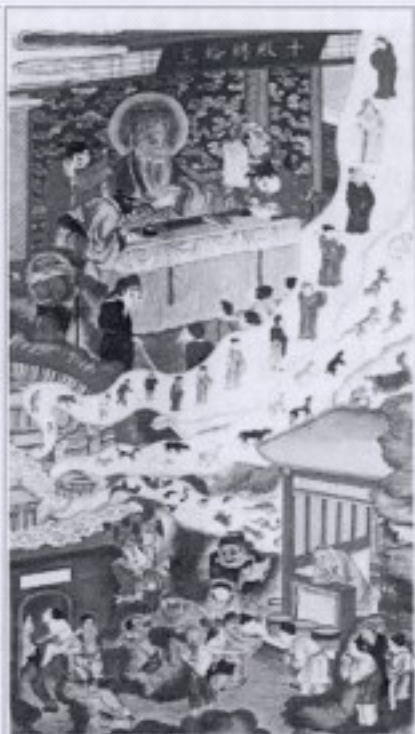
圖 4-1 King of Hell's Wheel

(c) 如果所作的業不會消失，就會好像自己的影子一樣跟著妳。根據業力的牽引作用，人死後會在六道中輪迴，天、阿修羅、人、畜生、餓鬼、地獄。不斷在死死生生，生生死死中輪迴受苦。除非徹底解決根本的問題（我執）才能脫離輪迴。