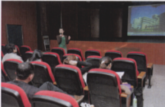
期末學生作業影展報告實況 ←