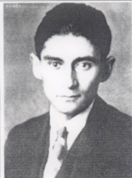
傅科 Michel Foucault