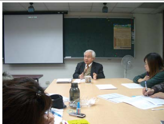
第六、七講分組討論