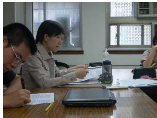
第十一講「京都帝國大學與臺灣舊慣調查研究」分組討論