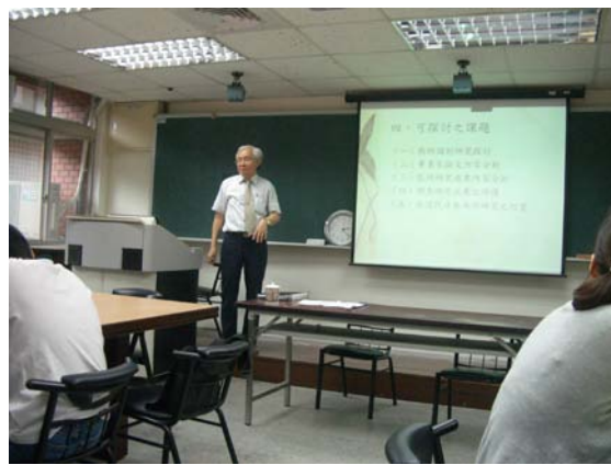
第十講「東京帝國大學與臺灣學術調查研究」授課情形