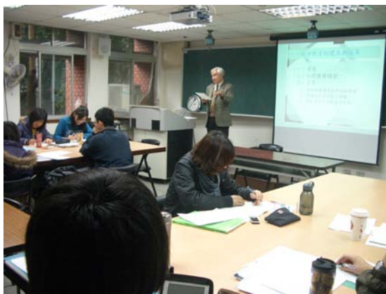
第九講「社會教育與臺灣社會之改造」授課情形