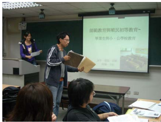
第五講「師範教育與殖民初等教育」分組討論時，同學分享珍藏史料