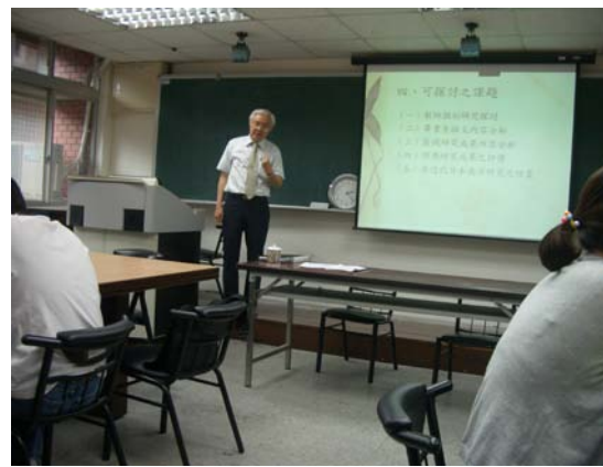
第十三講「臺北高等商業學校與南支南洋研究」授課情形