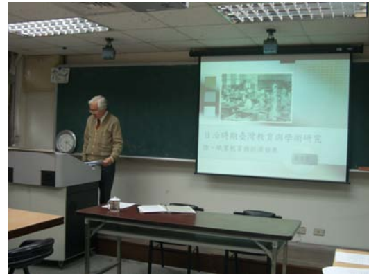
第六講「職業教育與經濟發展」授課情形