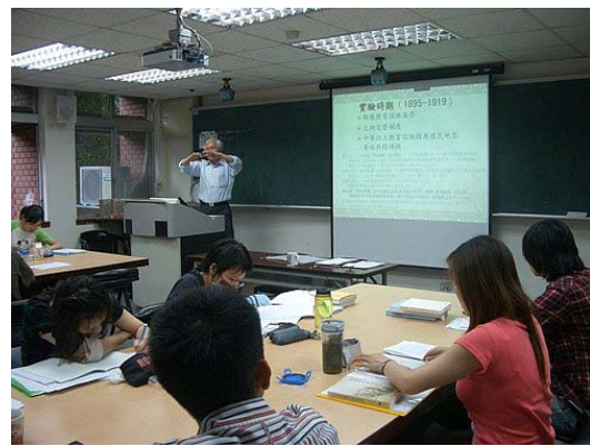
第三講「臺灣殖民教育政策與制度之演變」授課情形