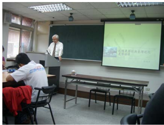
第十二講「札幌農學校與臺灣近代農學發展」授課情形