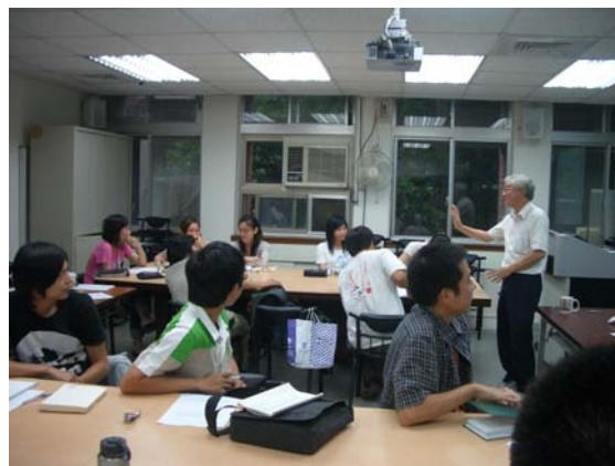
第十一講「京都帝國大學與臺灣舊慣調查研究」授課情形