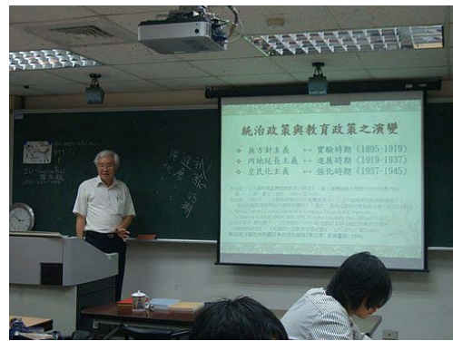
第二講「臺灣殖民統治政策與教育」授課情形