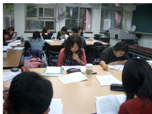
第五講「師範教育與殖民初等教育」分組討論