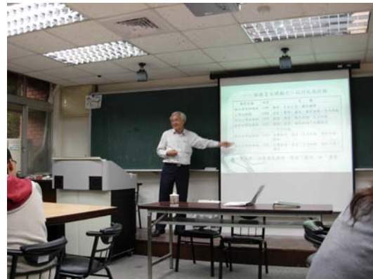
第四講「同化與現代化—以初等教育為例」授課情形