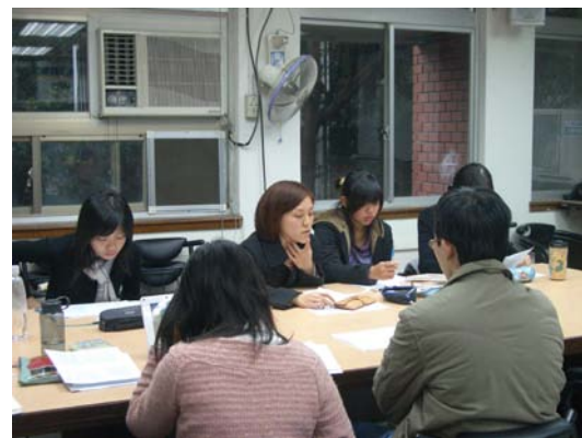
第六、七講分組討論