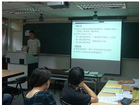
第二講「臺灣殖民統治政策與教育」分組討論