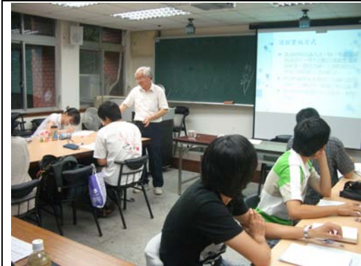
第一講「導論」授課情形