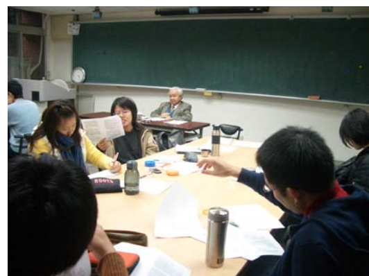
學生論文報告與討論