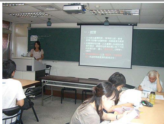
第三講「臺灣殖民教育政策與制度之演變」分組討論