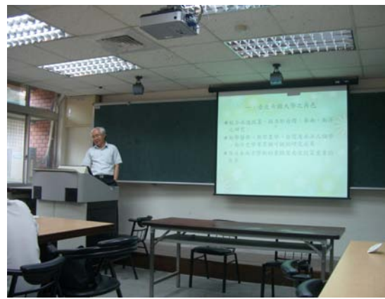
第十四講「臺北帝國大學與近代臺灣學術基礎之建立」授課情形