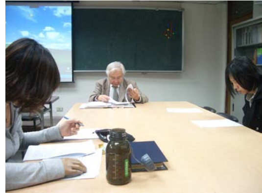
第八講「留學教育與臺灣社會精英之塑造」分組討論