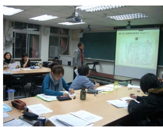
「文獻解析與研讀」授課情形