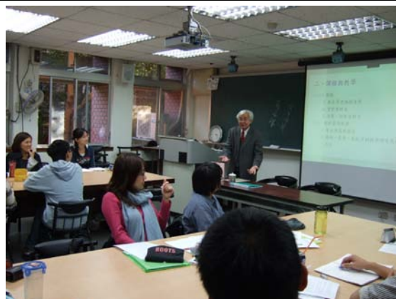
第五講「師範教育與殖民初等教育」授課情形