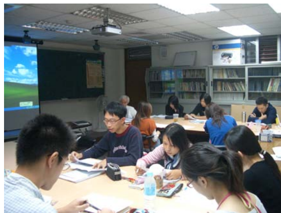
第四講「同化與現代化—以初等教育為例」分組討論