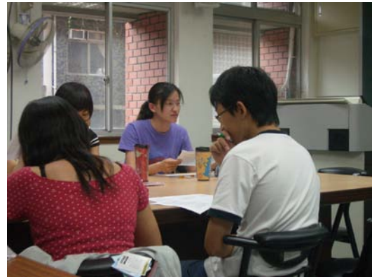
第十講「東京帝國大學與臺灣學術調查研究」分組討論