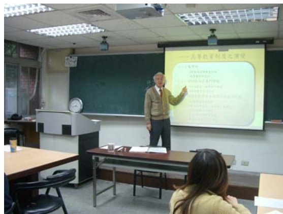
第七講「高等教育與臺灣社會精英之塑造」授課情形