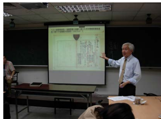
文獻解析與研讀（授課教師講解）