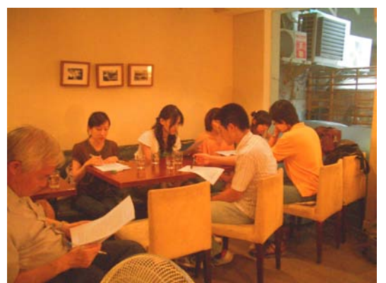
期末報告、聚餐情景