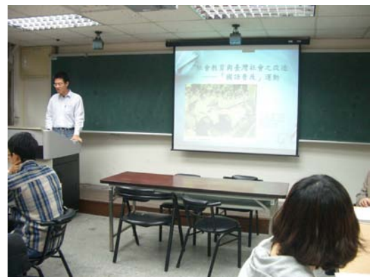
第九講「社會教育與臺灣社會之改造」分組討論