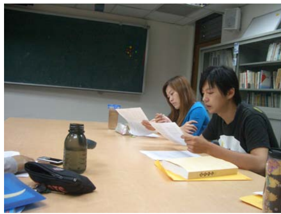
第十二、三講分組討論