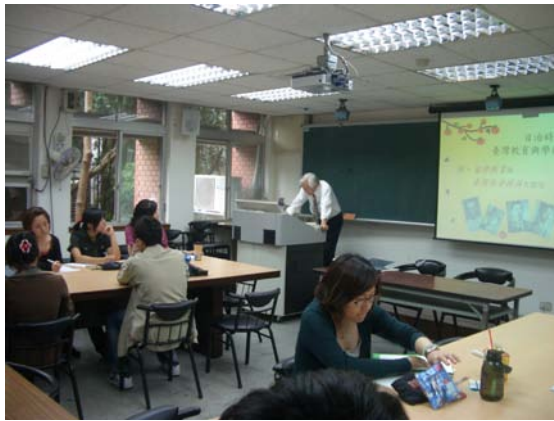
第八講「留學教育與臺灣社會精英之塑造」授課情形