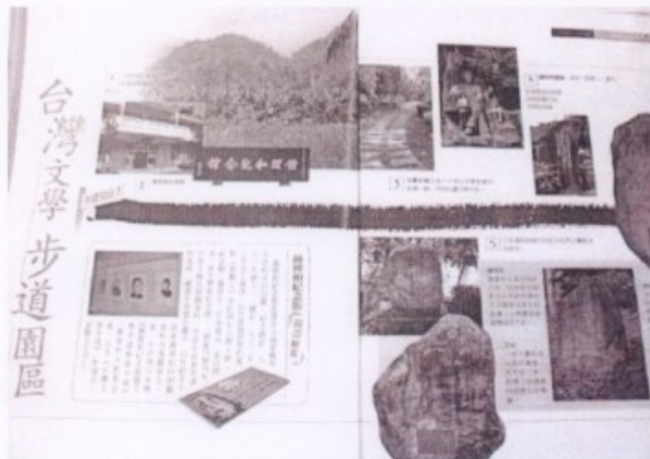
戰後文學相關教材