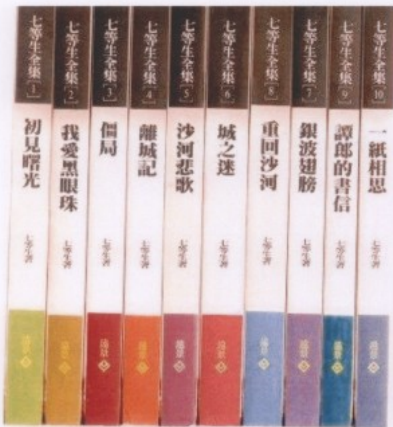
課程參考用文學文本