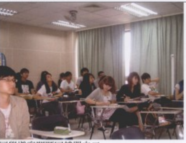
同學填寫問題回饋單之二