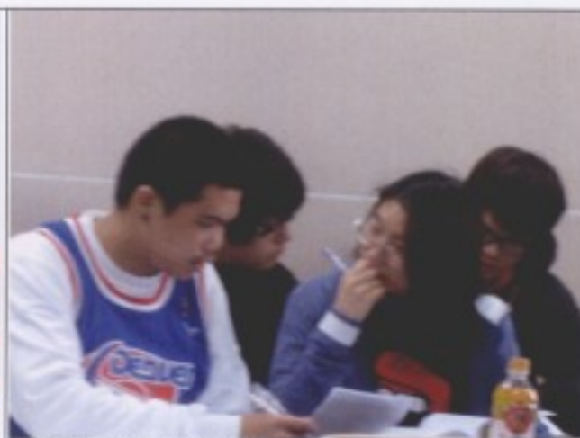
同學課堂討論情形之二