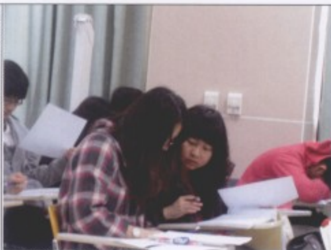
同學課堂討論情形之一