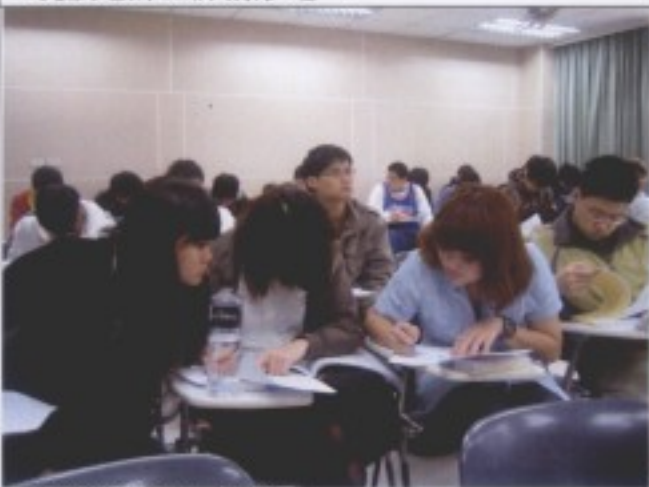
同學填寫問題回饋單之一