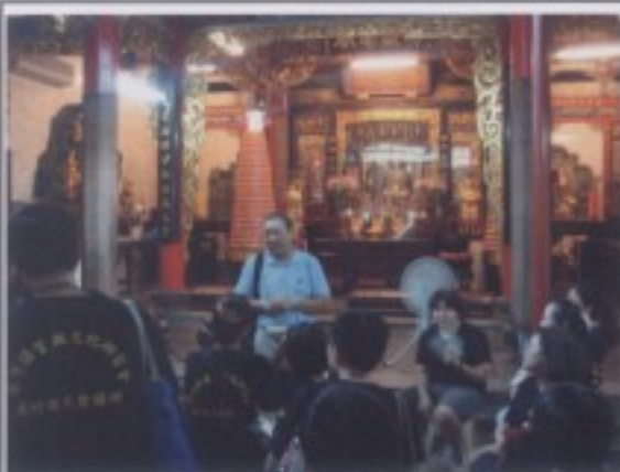
參訪行程二：都城隍廟