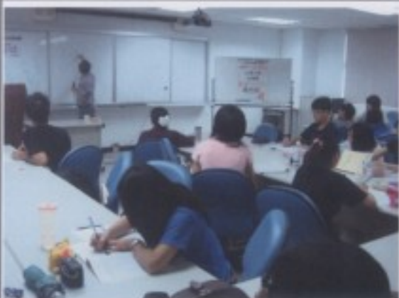
學員把握難得的機會，認真聆聽陳芳明教授講授「台灣文學史建構」。