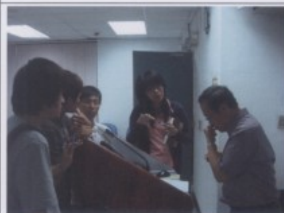
意猶未盡，只嘆研習時間太短。