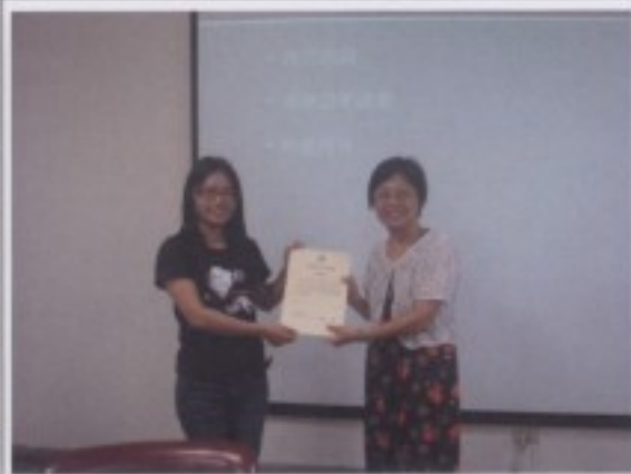
結業式：頒發結業證書