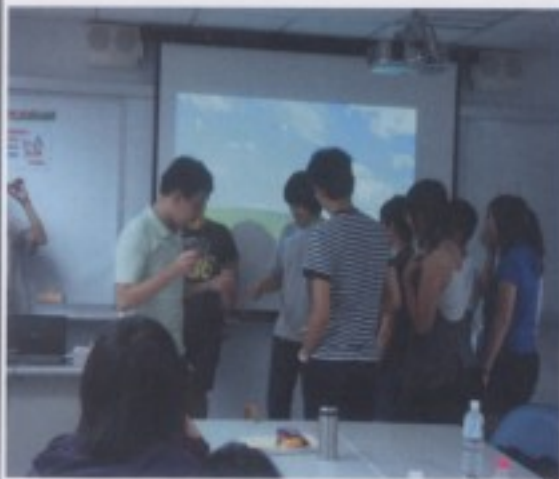
學員們到台前體驗各式童玩