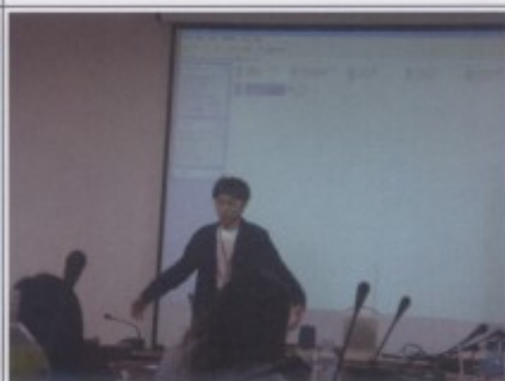
有口難言：失語症患者的痛苦