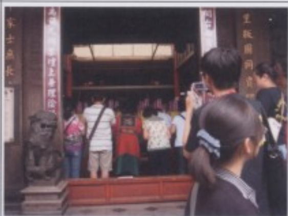
參訪行程一：開基祖廟。先民最初開發的定點。