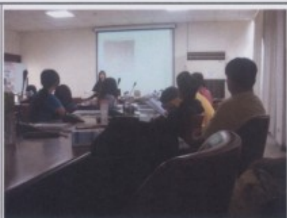
學員對於這個議題相當感興趣。