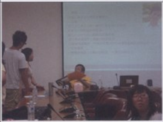
課後許多學員上前提問