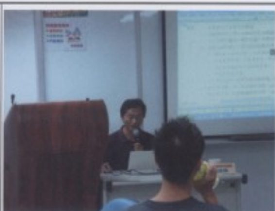
明立國老師講解原住民音樂