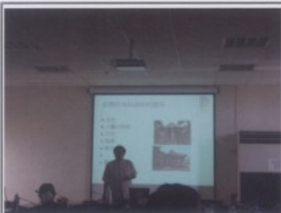
「原住民文學」上課情形