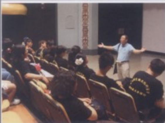
參訪行程四：新竹市影像博物館