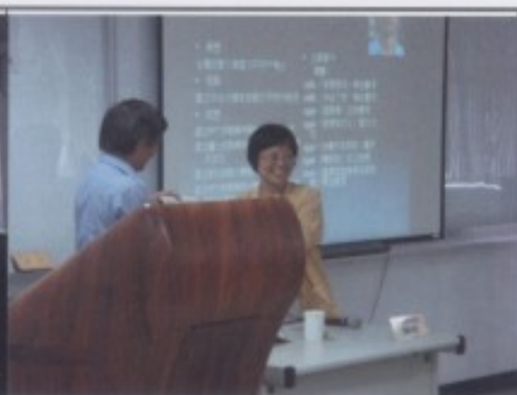
營長致贈感謝狀給羅肇錦教授