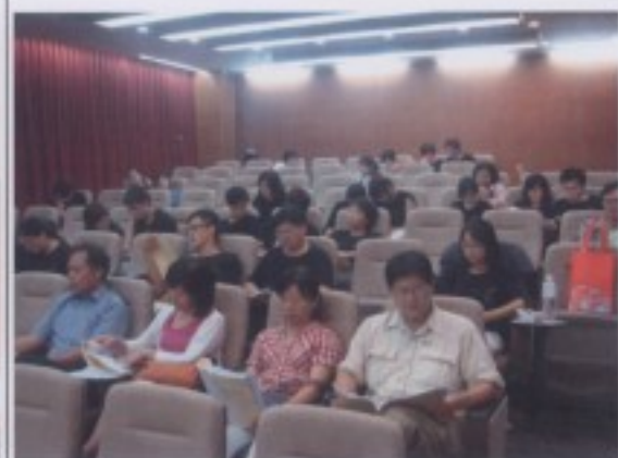
「台語語音真美妙-台語詩謔、歌曲創 作」上課情形