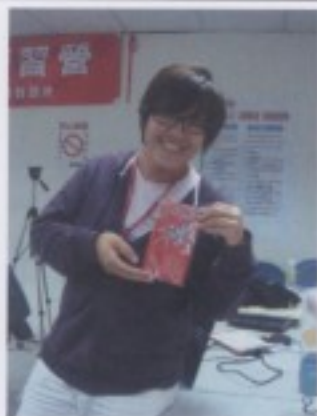
作品完成：客家花布書衣筆記本