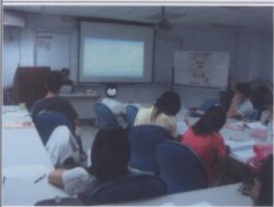
「原住民音樂」課程上課情形