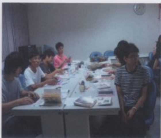
準備製作布書衣：認真聽講。