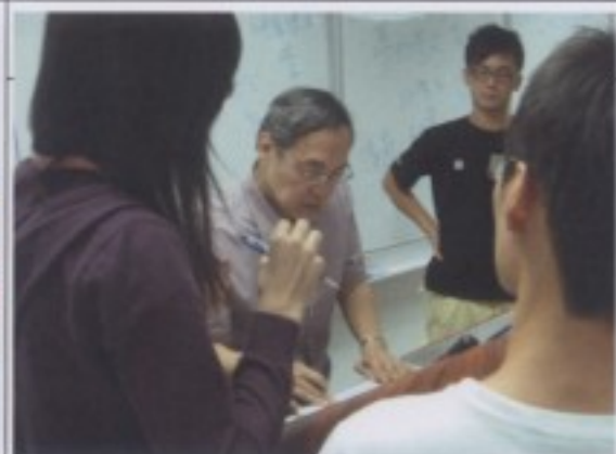
下課時，學員到講台前問問題。