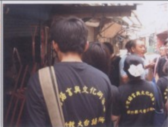
參訪行程三：傳統農具店