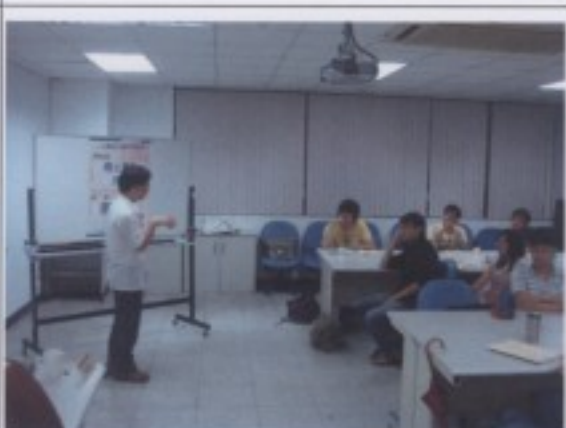
鄉土電影欣賞：魔法阿嬤，從電影裡搜尋台灣文化及有趣的語言現象