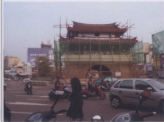
參訪行程五：新竹市東門城