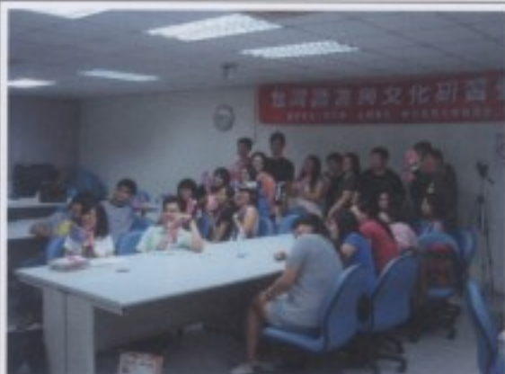
作品與學員大合照：收穫滿滿。