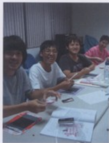
動作快的學員正在準備下一步驟，非常有成就感。