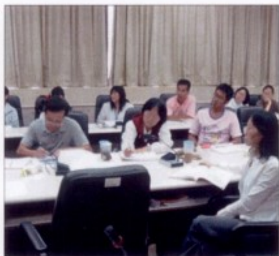
中南部客家文學與 人物介紹