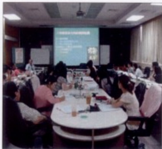
六堆文化特質與內涵