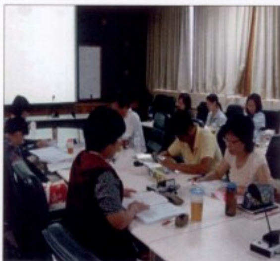
閩客族群關係探討