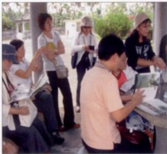
六堆客家田野采風