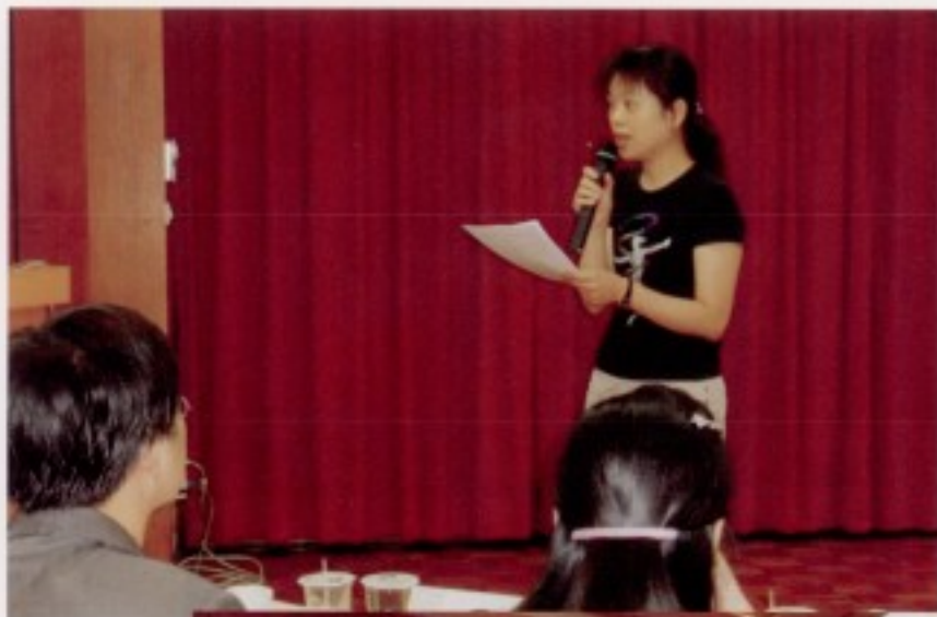
◁ 小組相互評論教學演示