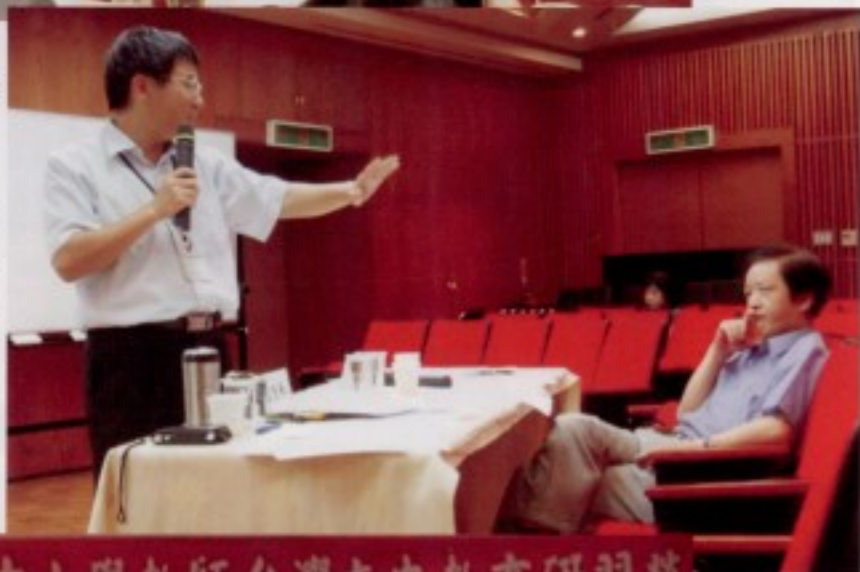
▷ 老師評論各組教學演示

2007中小學教師台灣文史教育研習營 指導單位：教育部 主辦單位：國北教大台文所