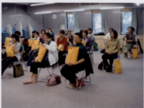
0516 座談會－學員領取紀念品