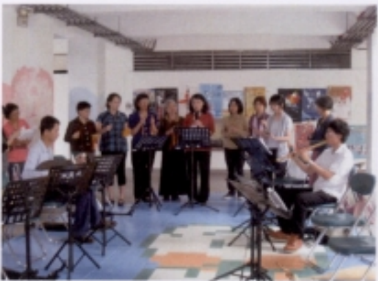
0516 成果展－第三組學員