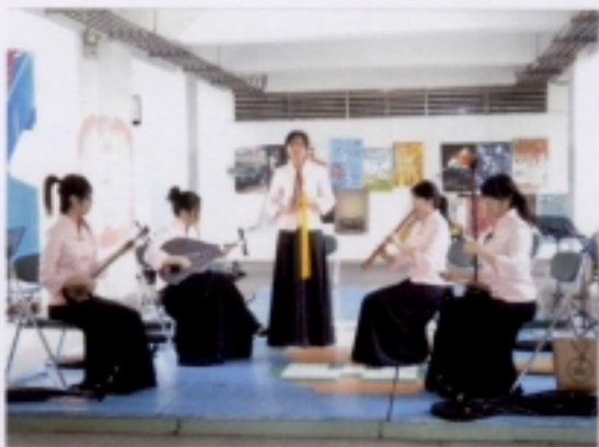
0516 成果展—本系學生示範