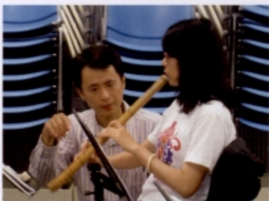
0508 蕭絃演練—助教個別教學