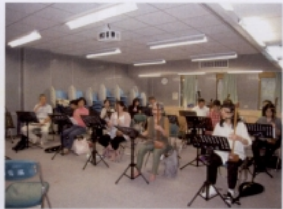
0509 簫絃演練－學員實作