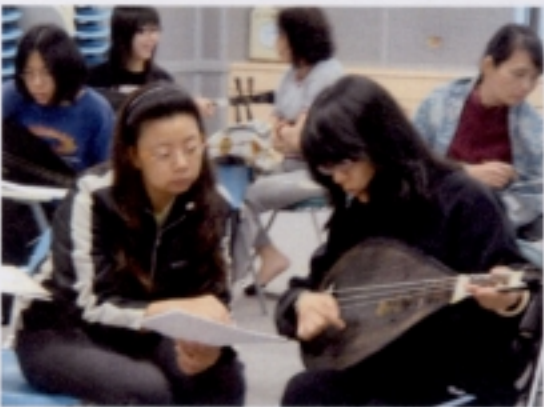
0502 琵琶演練－學生實作