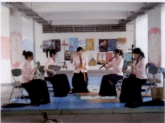
0516 成果展—本系學生示範