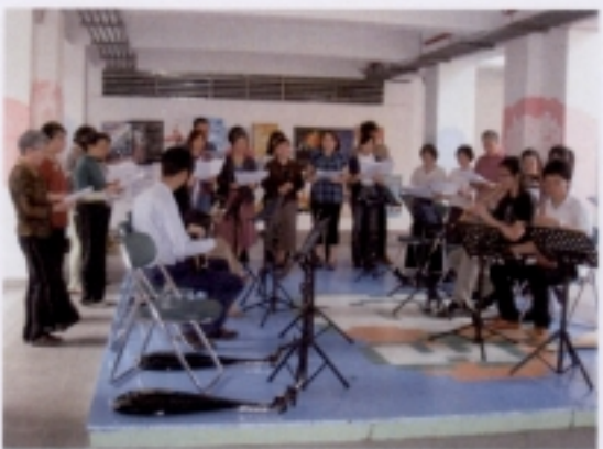
0516 成果展－學員大合唱