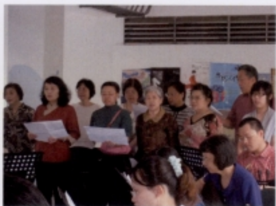
0516 成果展－學員大合奏