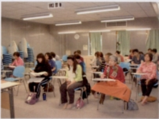
0502 工尺譜唱唸－學生練習