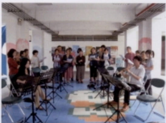
0516 成果展－第二組學員