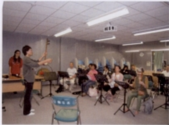
0509 簫絃演練－助教示範