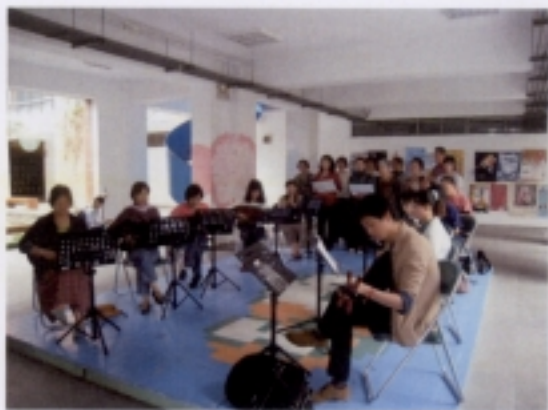
0516 成果展－學員大合奏