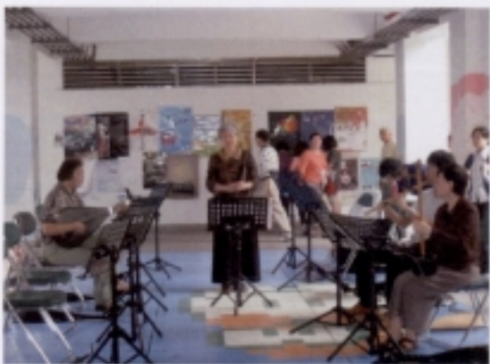
0516 成果展－第一組學員