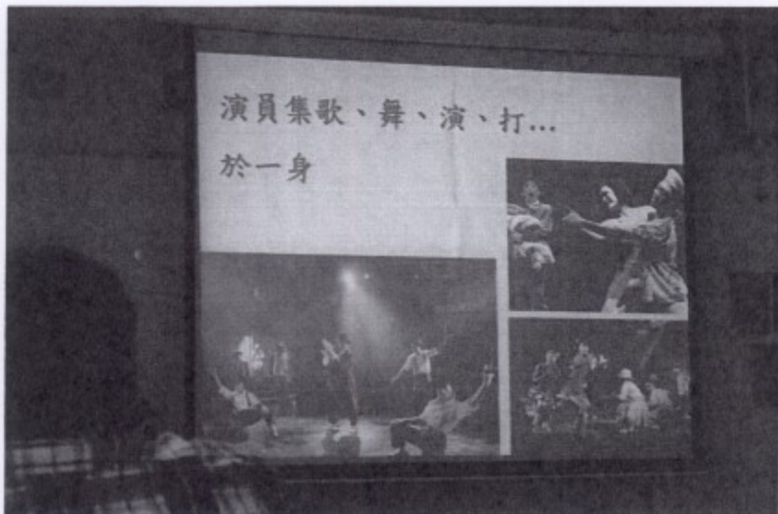
98 年 5 月 20 日金枝演社講座