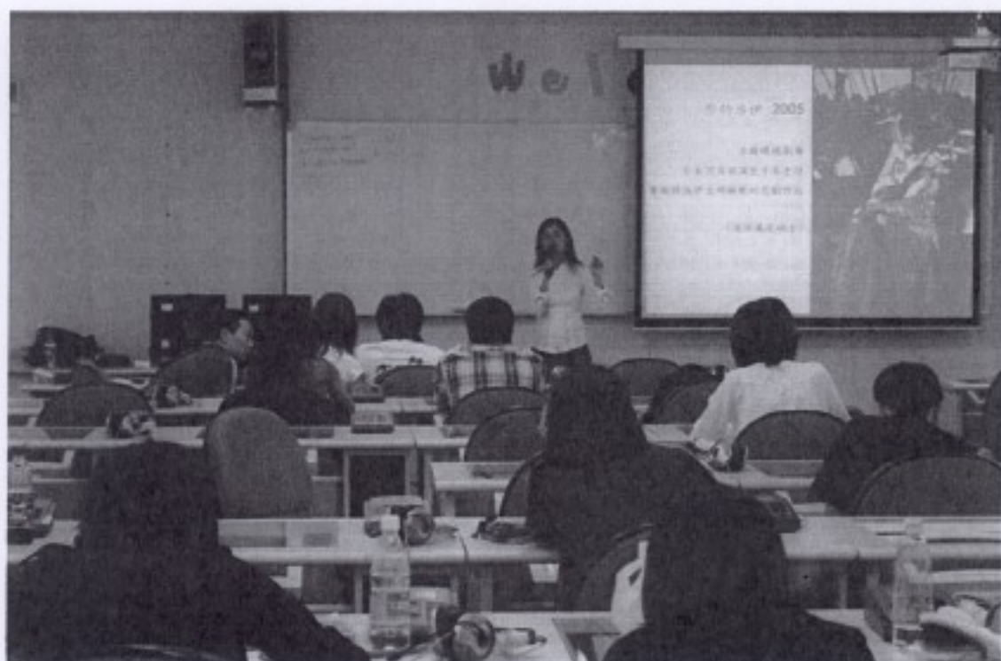
98年5月20日金枝演社講座