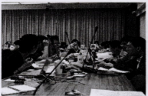
與會同學在休息時，仍是討論熱烈。