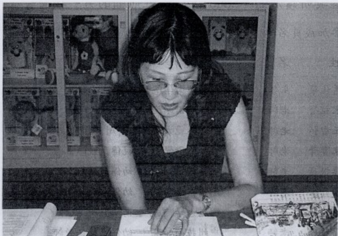
starting at home: caring and social policy part 2 導讀人: 潘雅鈴 老師