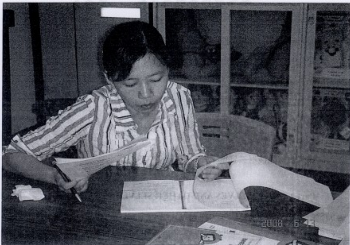
starting at home: caring and social policy part 3 導讀人: 林曉芳 老師