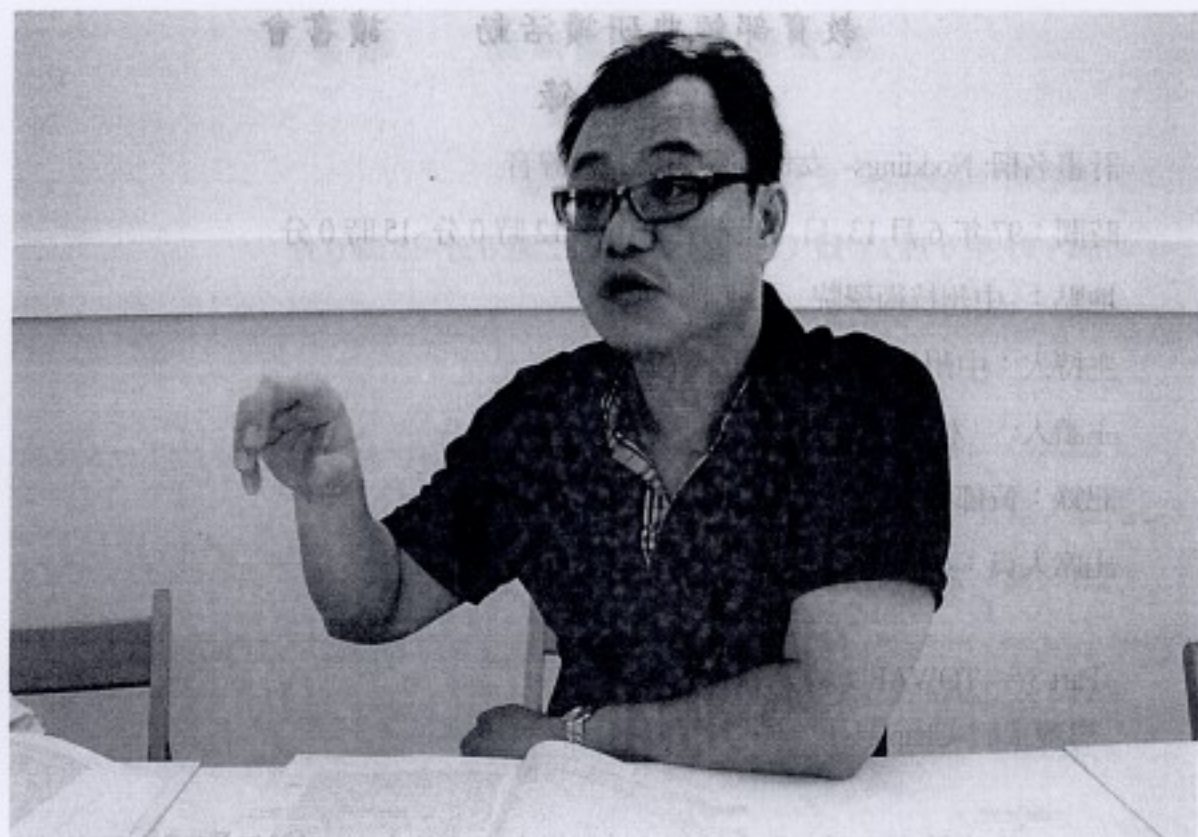
Starting at home: caring and social policy part 1 導讀人：朱寶青 老師