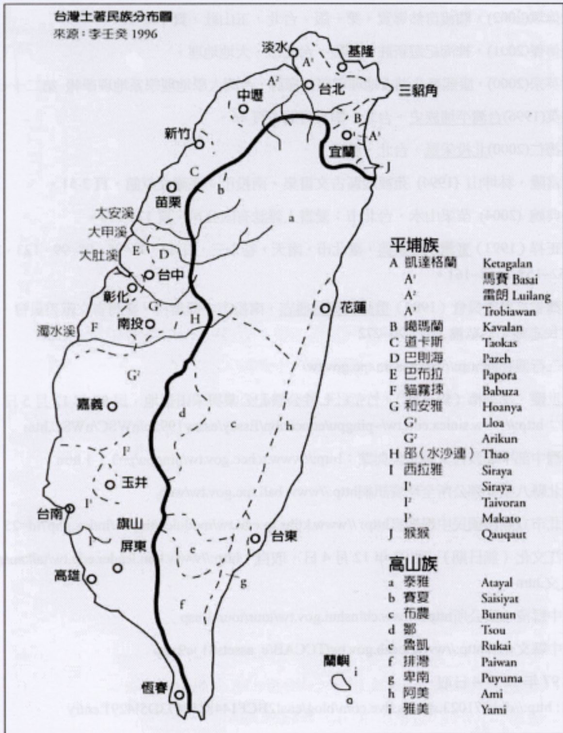
圖 3 台灣土著民族分布圖