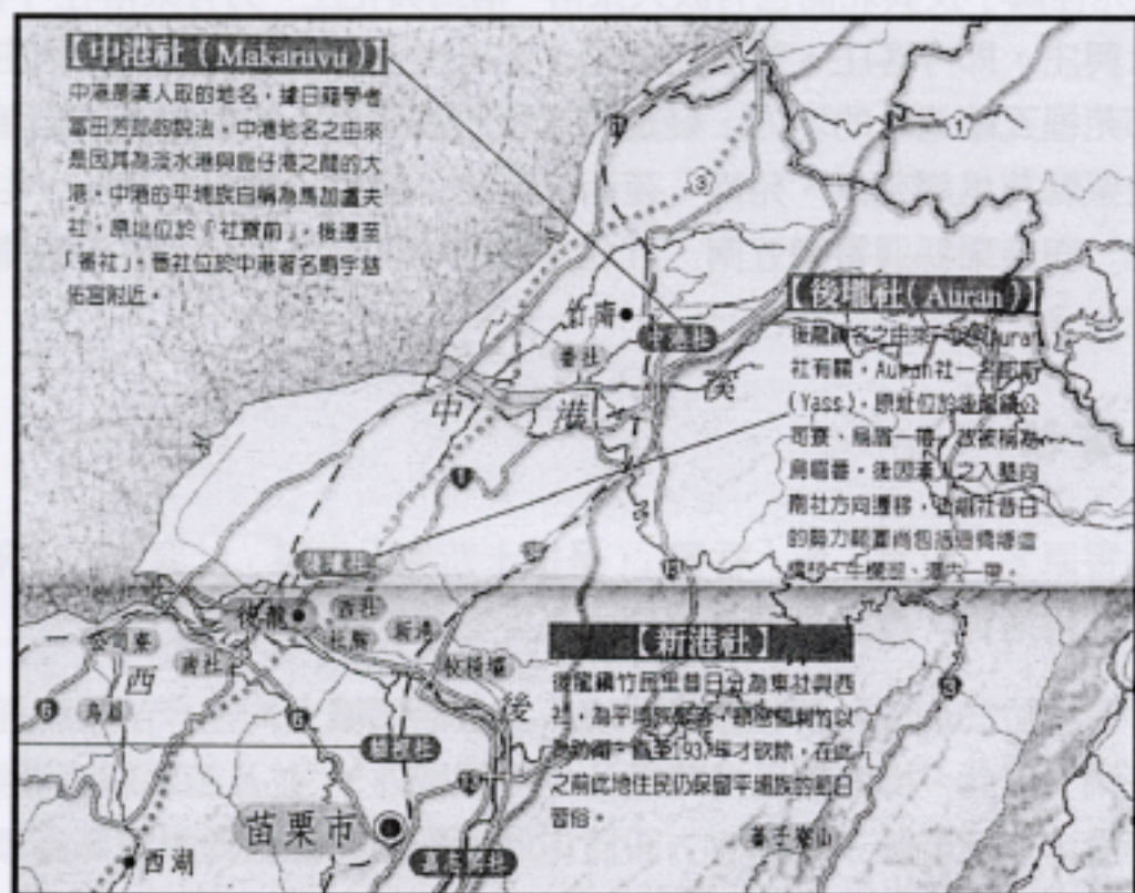
圖 1 新港社、後壘社、中港社分布圖

新港社(位今苗栗縣後龍鎮)、後壘社及中港社(位今苗栗縣竹南鎮)皆屬於道卡斯族，在清代方誌中與貓裡社、嘉志閣社(皆位於今苗栗市)兩社合稱為「後壘五社 1 」。