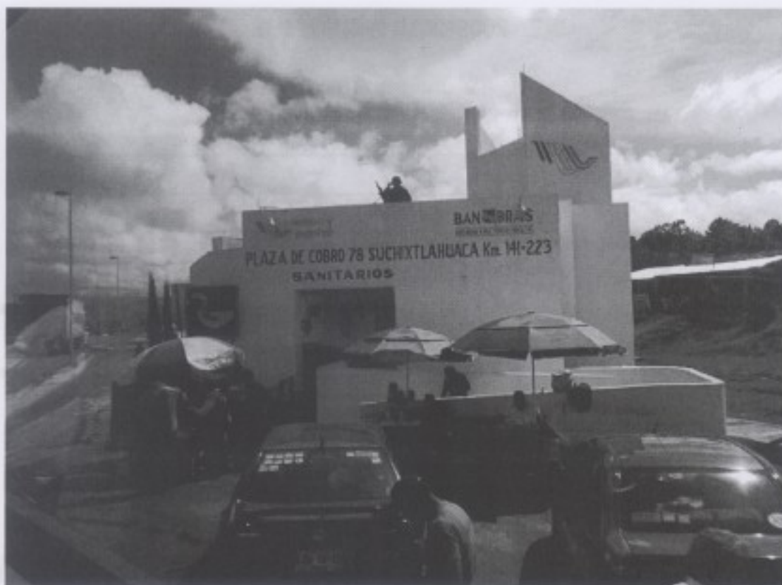
圖五 墨西哥公路驛站警備森嚴