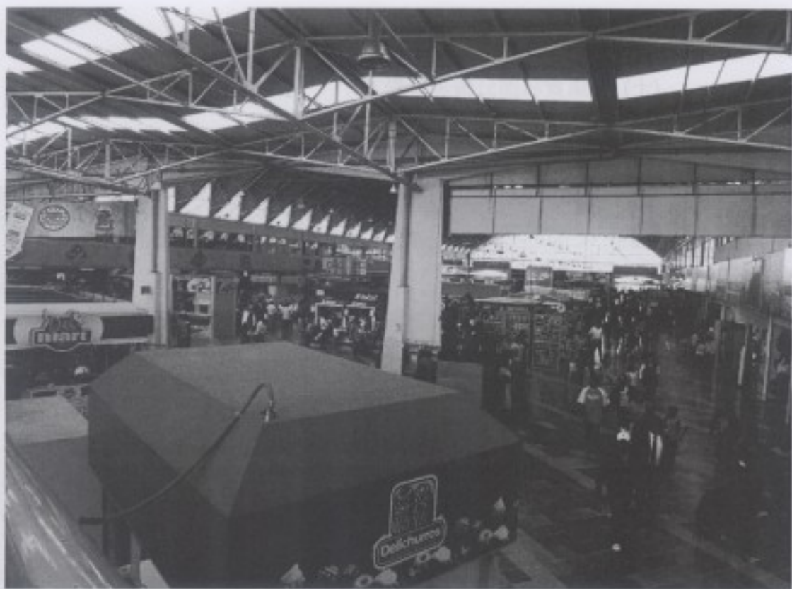
圖二 墨西哥當地公車總站一角