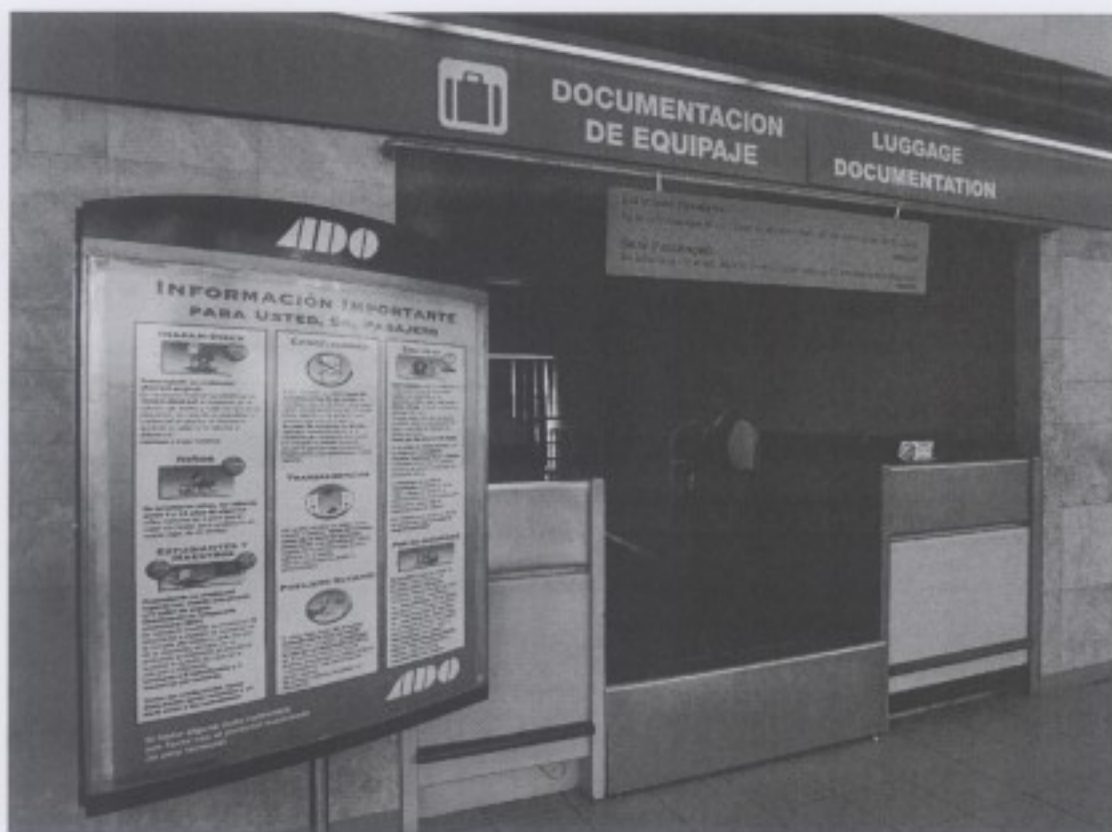
圖三 墨西哥公車站行李託運處