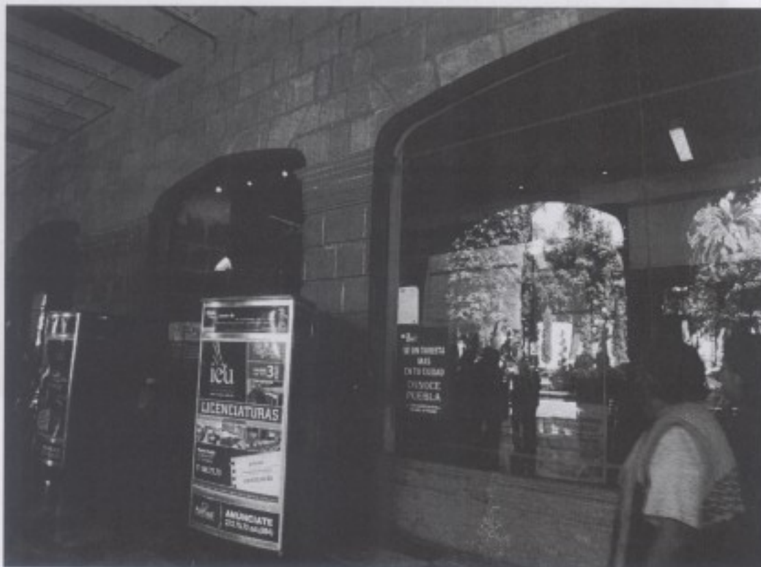
圖一 墨西哥當地旅遊觀光局