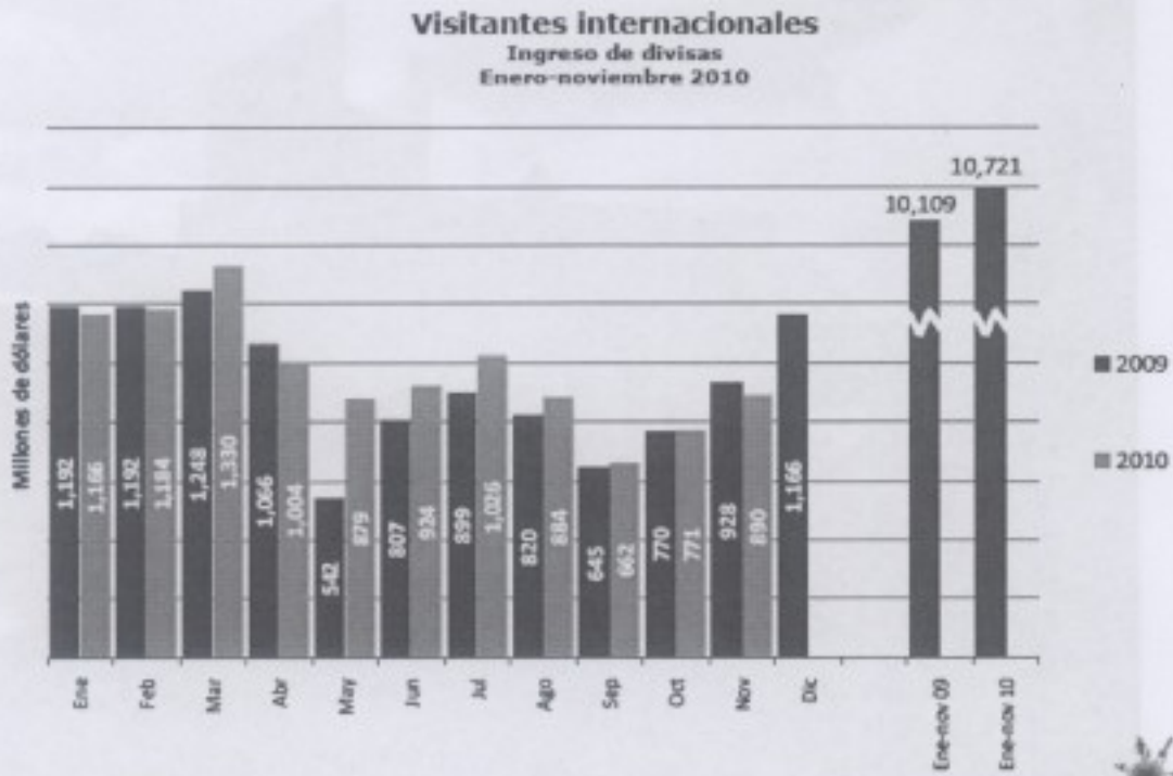
表二 2009-2010 外國旅客赴墨西哥經濟成長數據