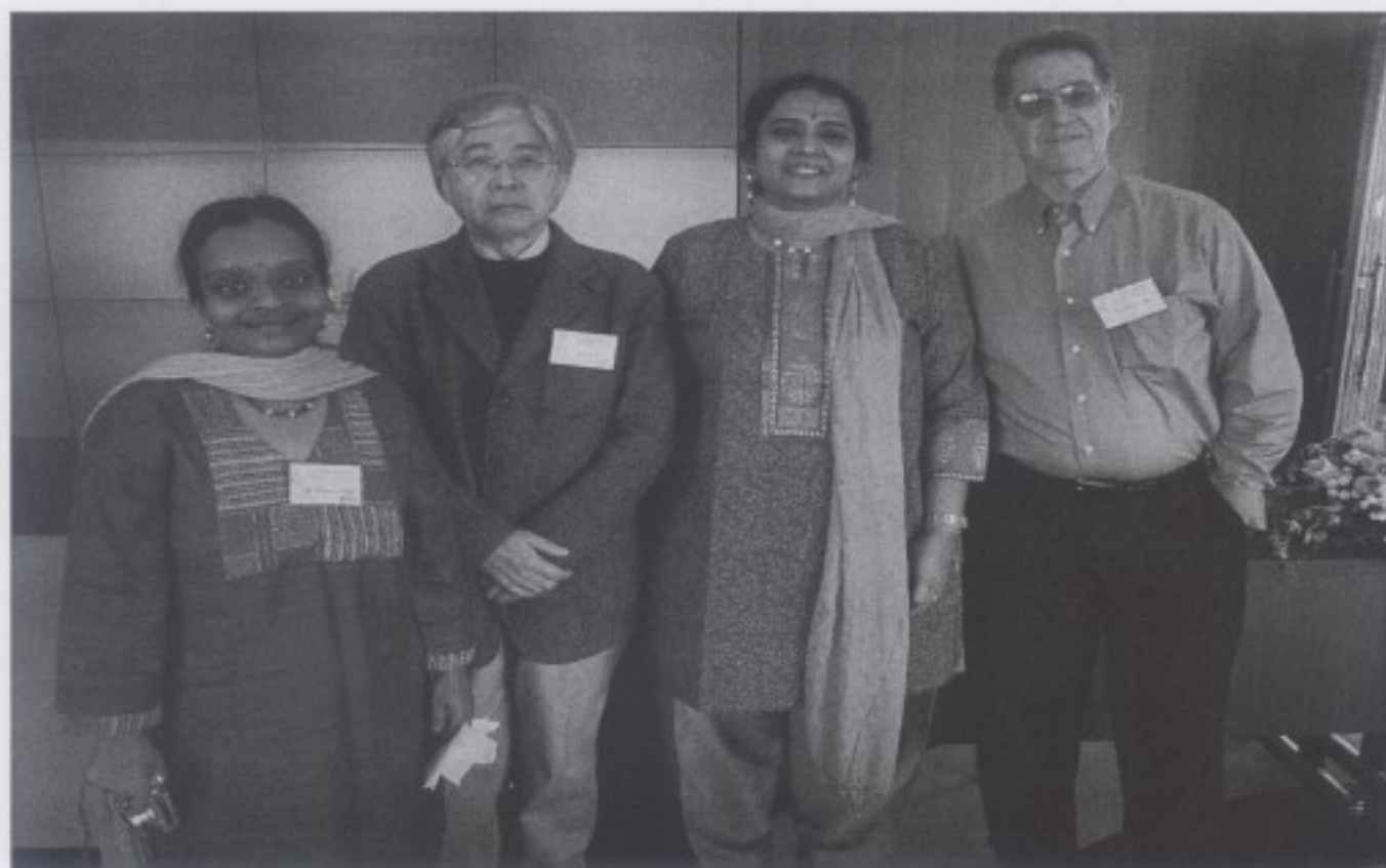
印度學者、日本學者及美國學者於會議期間合照