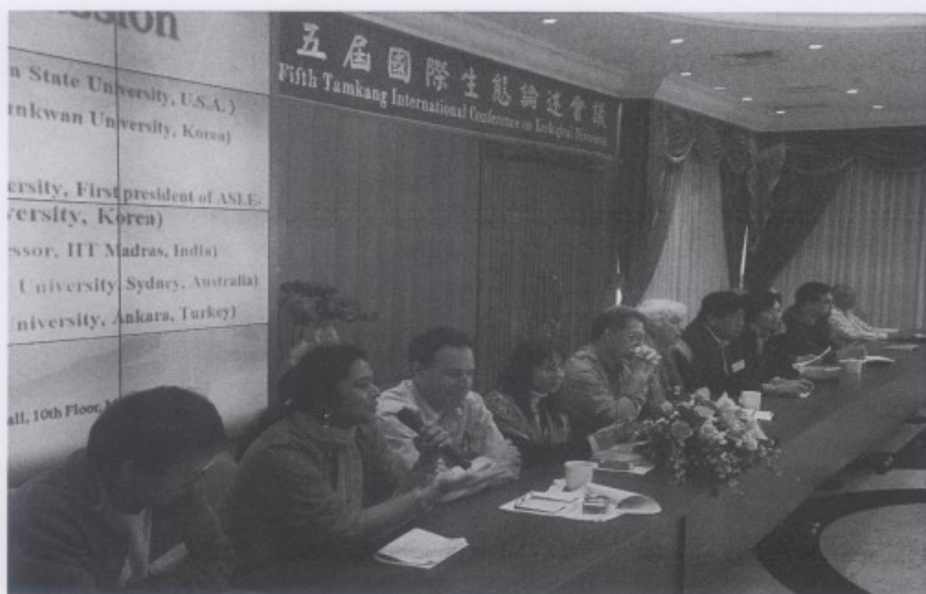
Roundtable 由來自中國、印度、美國、土耳其、西班牙、日本、台灣、加拿大之各國代表學者於開幕式發表