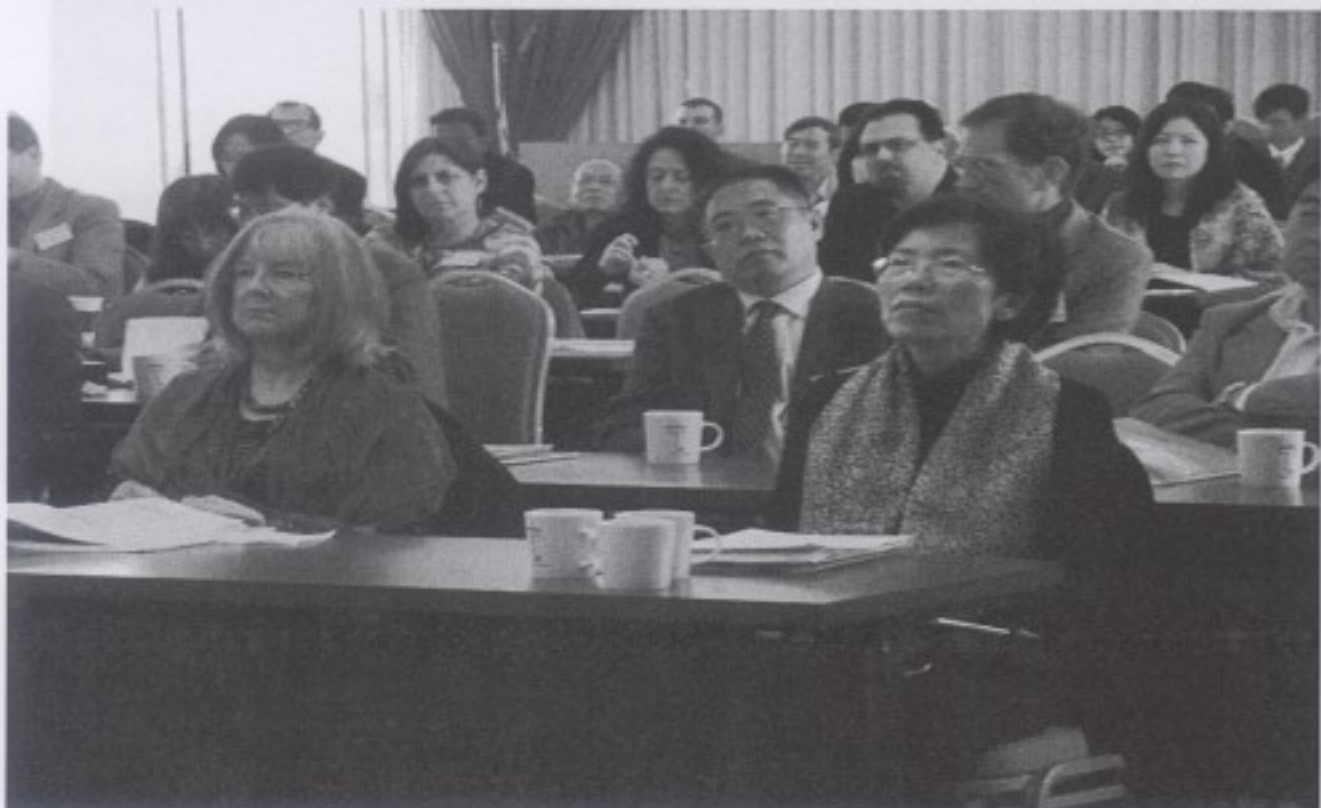
本屆會議邀請國際知名作家 Linda Hogan 為本次會議帶來生態文學丰采