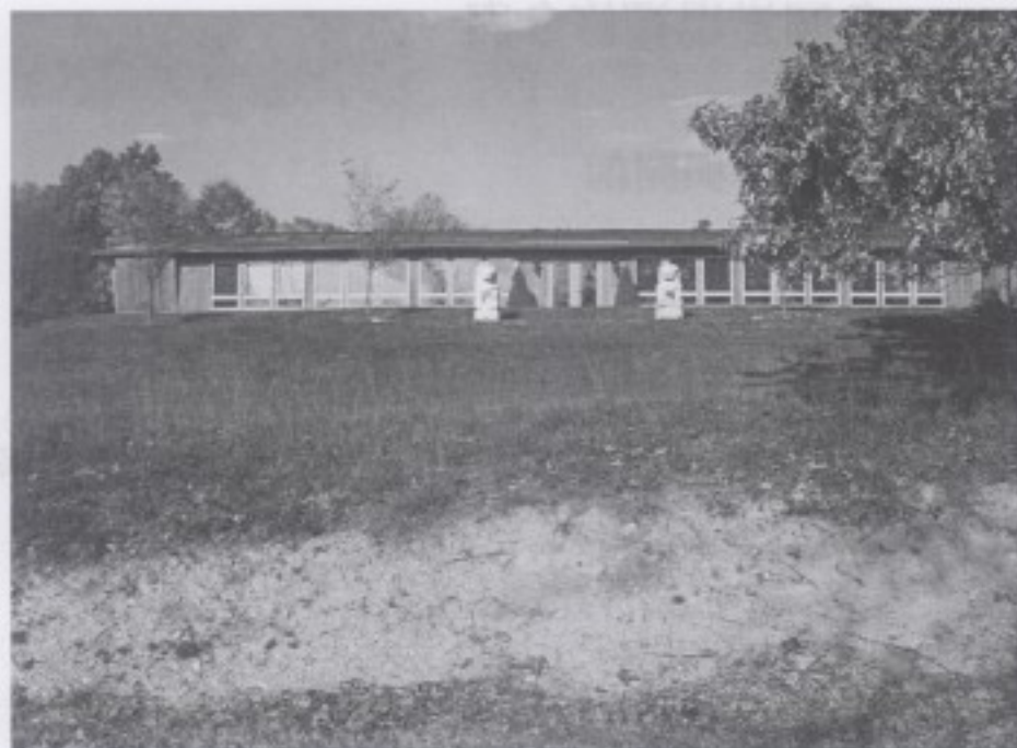
象岡道場禪堂外觀 分別拍攝於2010、10月與12月

2000年5月聖嚴法師在紐約象岡道場，指導禪修打七個默照七。連續四十九天的默照禪修，開創中國禪宗史上的新紀元