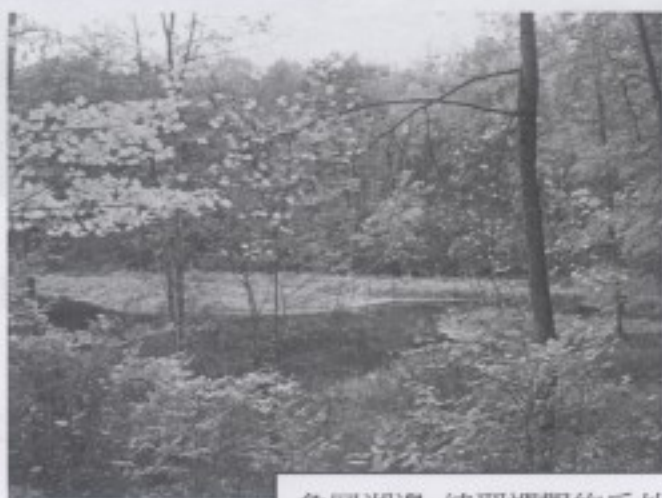
象岡湖邊 練習禪觀的戶外環境