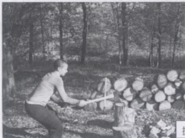
捷克籍的象岡義工出坡