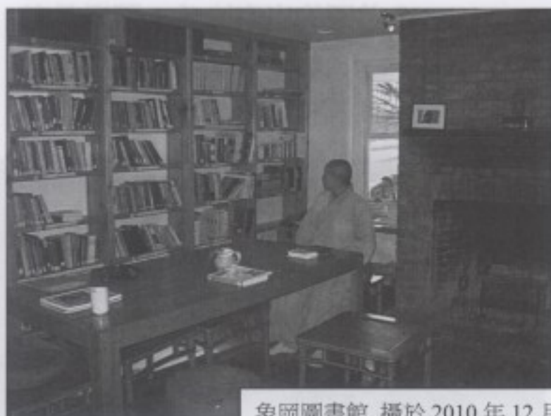
象岡圖書館 攝於 2010 年 12 月