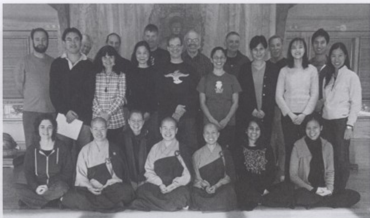
2010年10月拍攝於象岡道場禪堂