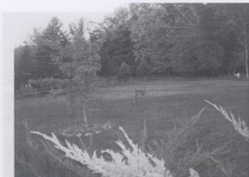
禪修期間戶外的經行環境