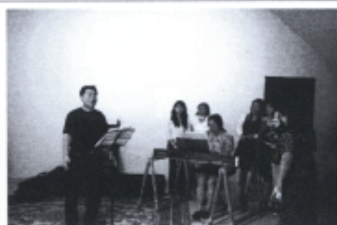
照片八 密集訓練授課剪影