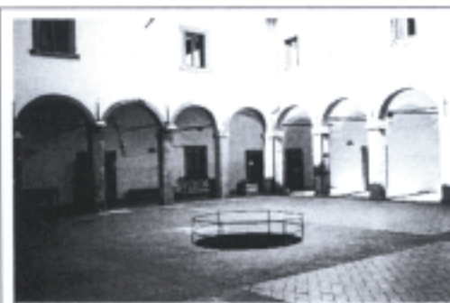
照片六 阿果斯汀大教堂「中庭」