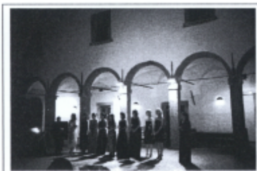
照片十二 成果發表音樂會(二)