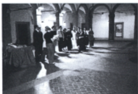
照片九 音樂營閉幕, 市長頒發結業證書