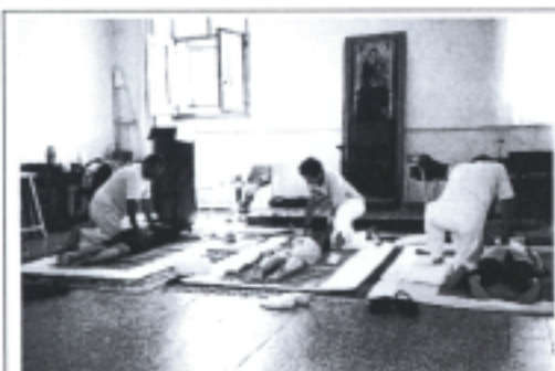
照片五 Shiatsu 協助歌唱者放鬆