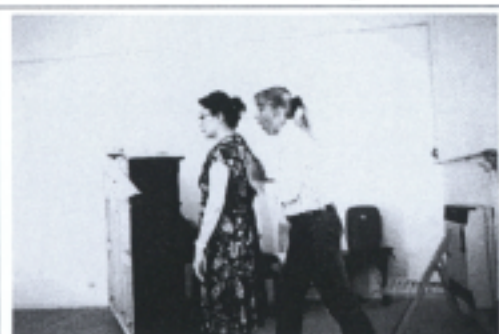
照片二 女高音 Picco 教授授課剪影