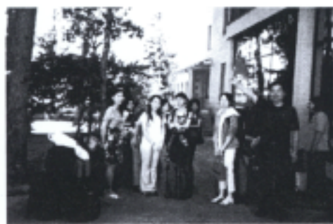
照片十 歷史古蹟參觀剪影