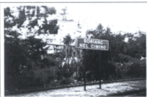
照片一 蘇麗阿諾城