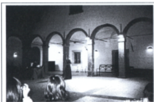
照片十一 成果發表音樂會(一)