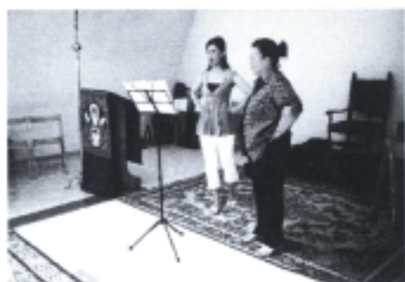
照片七 個別授課授課剪影