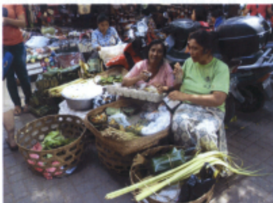
1.從市場買入製作Offering的材料