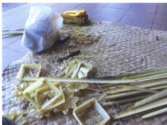
3.基本椰子樹葉底盤製作