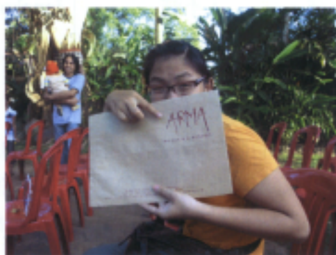
ARMA 美術館祭品製作課程結業證書