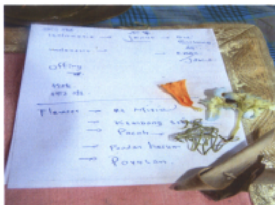
5.認識底盤上所放置花卉類別