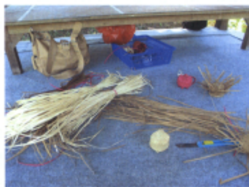
魯基桑美術館編織籃子課程-材料