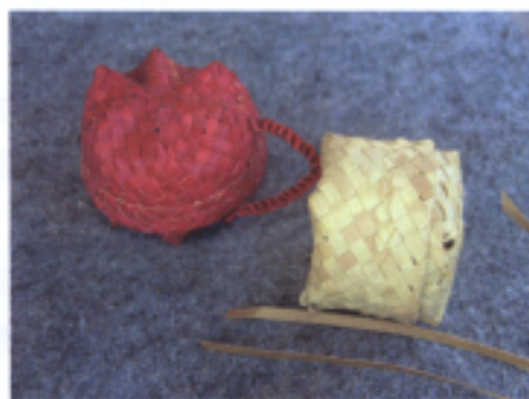
魯基桑美術館編織籃子課程-範例成品