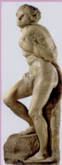
Michelangelo 反抗的奴隸 1513 Louvre, Paris