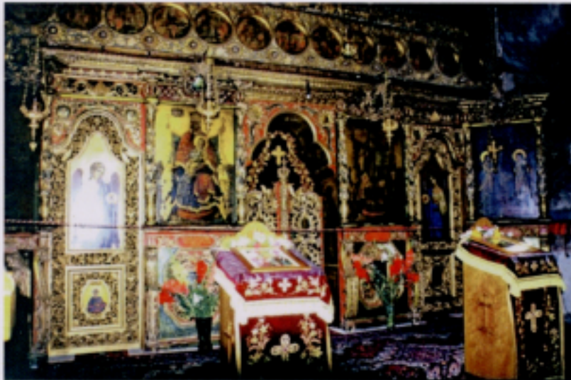
Bucovina's painted Moldovita monasteries