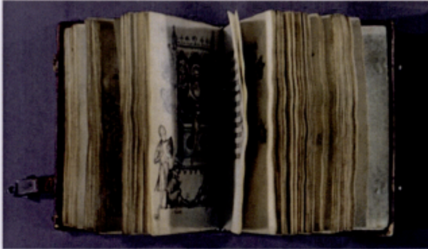
HOURS OF JEANNE D'EVREUX in The Metropolitan Museum of Art