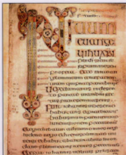
Book of Durrow · 247*228 · 248 folios · insular script · Trinity College Library · Dublin It was started in 650(?) , possibly the oldest extant complete illuminated gospel from Ireland or Britain . St. Mark 4