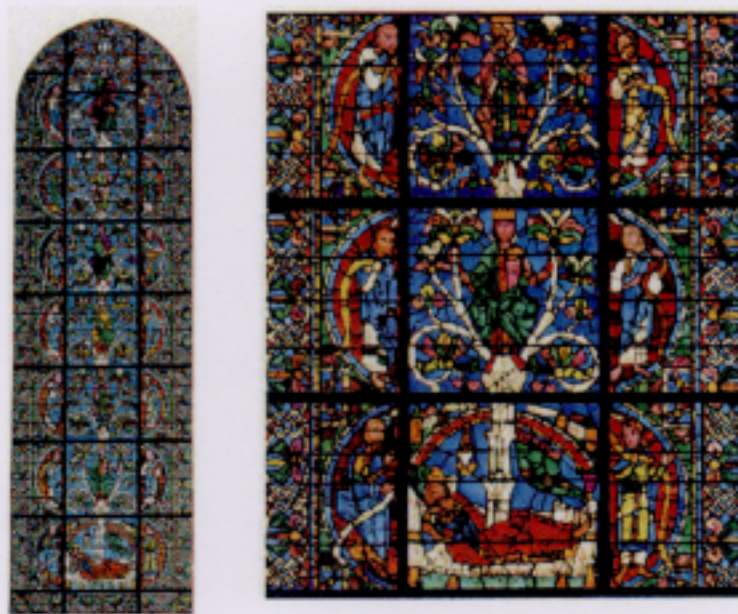
Tree of Jesse west façadeca. 1150-1170