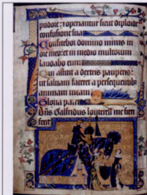
Dns (= Dominus) Galfridus Louterell me fieri fecit - Lord Geoffrey Luttrell had me made 騎馬的莊主及其妻、媳