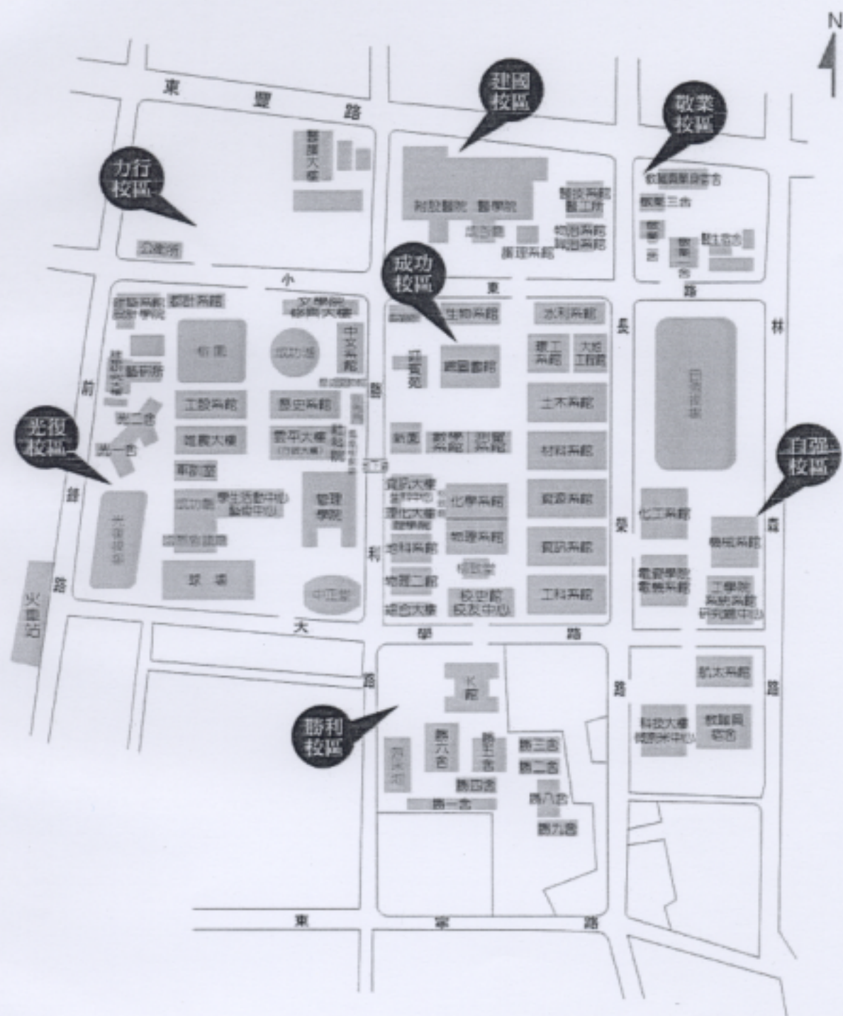
國立成功大學 校本部平面圖