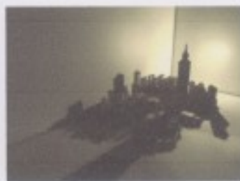
(築城作品展覽現場裝置圖) (築城作品展 3D 模型圖)