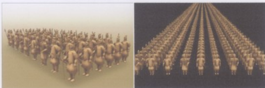
(陵兵陣作品展 3D 模型圖)