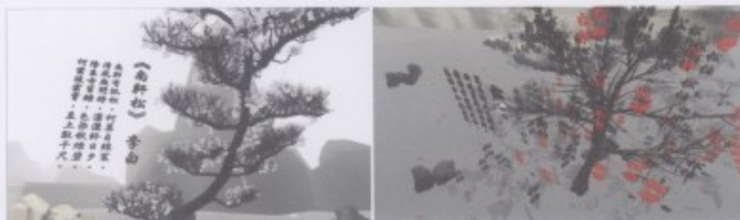
(字衍作品互動數位影像畫面)