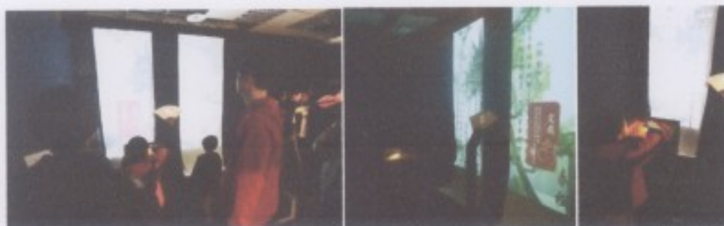
(字衍作品現場觀眾互動過程)