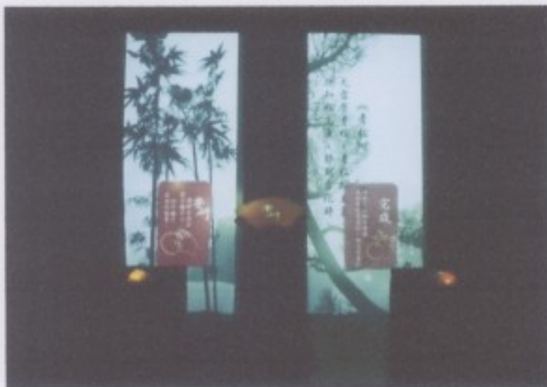
(字衍作品展覽現場裝置圖)

詩詞之美，觀者自知。中國漢字簡練，涵蓋意涵之大，一字難以形容。透過植物生長的概念，將文字暗喻為種子，種入土壤，種子發芽即為字生，植物生長輪迴即為字滅。透過中國詩詞對於植物的描寫，將詩詞中的情境帶入現代，提供觀者對詩詞不同的情懷，引起觀者對漢字新的感動。