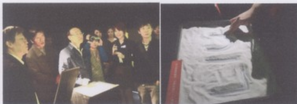
(陵兵陣作品現場觀眾互動過程)