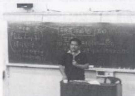
石教授講授台灣與上海的流行音樂譜帶關係