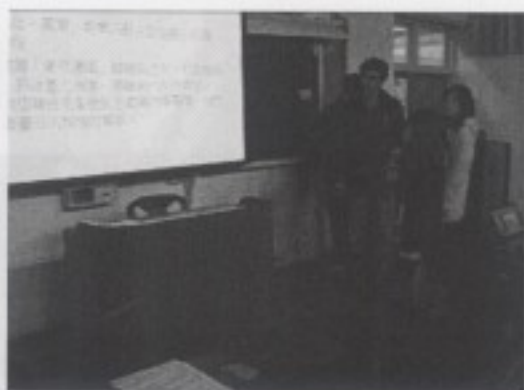
西門町娛樂事業之歷史變更