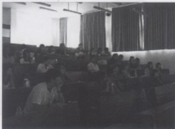
同學觀賞電影舊情綿綿專注的神情