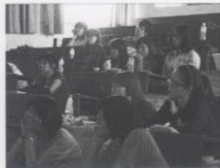
學生觀賞聖保羅炮艇之神情