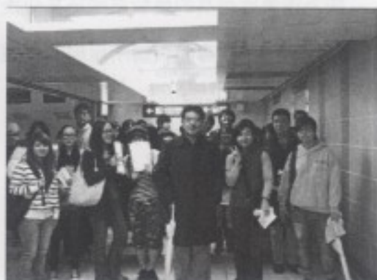
石教授與修課同學合照