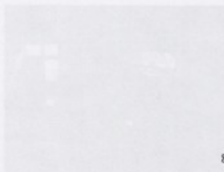
對大稻埕環境進行研究之情形