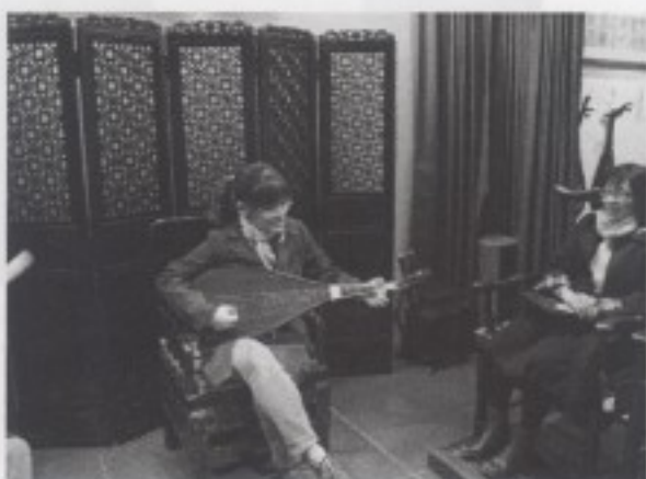
二樓為南管音樂之展演場所，圖為台大音樂所研究生示範並講解南管音樂之演奏以及與大稻埕茶行之歷史連結