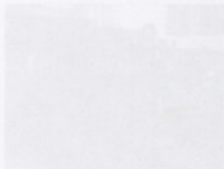
對大稻埕環境進行研究之情形