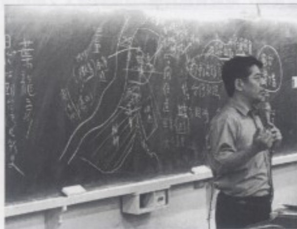
石教授講解城市音樂空間研究在音樂學研究領域的可能