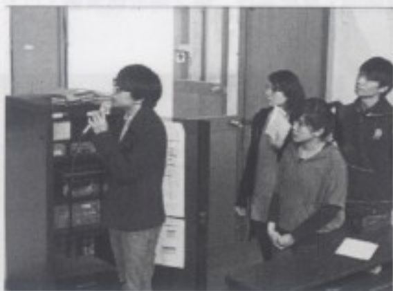
分組同學進行報告(一)—那些來自大稻埕的歌聲

此次課程為學生踏查作業正式口頭報告，同學報告內容類別說明如前所述，石教授並在每組同學報告後進行評述。