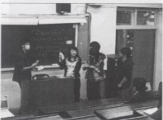
台北市音樂教室分布