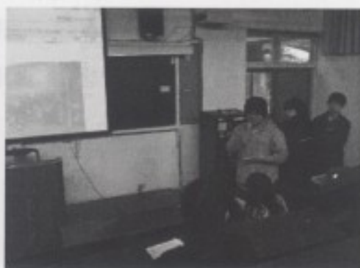
分組同學進行報告