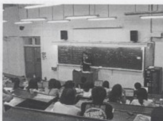
石教授針對大稻埕之環境進行研究