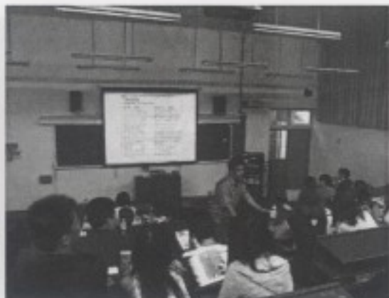
上課時學生專心聽講