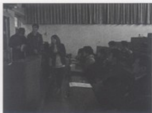
同學進行小組報告

此次課程為 GIS 軟體運用講授第二階段，並且發放期中考考卷，講解評分標準，以及各組同學上台進行初步的訪談結果之初步分享。