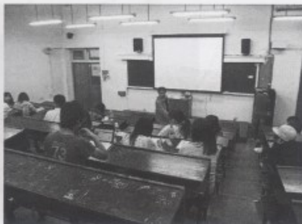
石教授講解電影舊情綿綿生成之背景