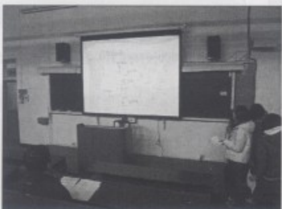
分組同學進行報告(三)—大稻埕地圖流變