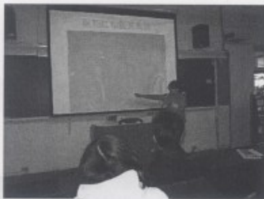
卡拉 ok 踏查之組別

此次課程為學生踏查作業之第二次課程報告。同學報告內容類別說明如下：大稻埕之卡拉 ok 歌曲之分布、艋舺寶斗里文化現象、台北市音樂工作室分布、三重電影院之分布、西門町娛樂營業場所之歷史變更等議題。