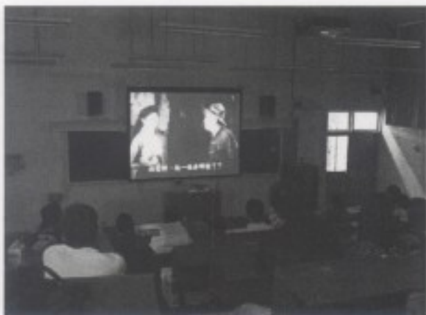
同學觀賞電影舊情綿綿之片段

本次課程觀賞由寶島歌王洪一峰所主演之舊情綿綿，本片拍攝於1962年，導演邵羅輝看中洪一峰創作歌曲《舊情綿綿》在廣播節目、唱片中廣為流傳，便以同名電影《舊情綿綿》構思劇本，商請洪一峰加入演出，電影在戲院播出後，一砲而紅，也開啟了歌星跨足影壇的歷史性一頁。而石教授在觀賞後進行總結，解釋此電影的成功其一為當年代的媒介迴路促成，也就是說，媒介迴路造就洪一峰的成功，而洪一峰又是構成媒介迴路中的其中一個因子。