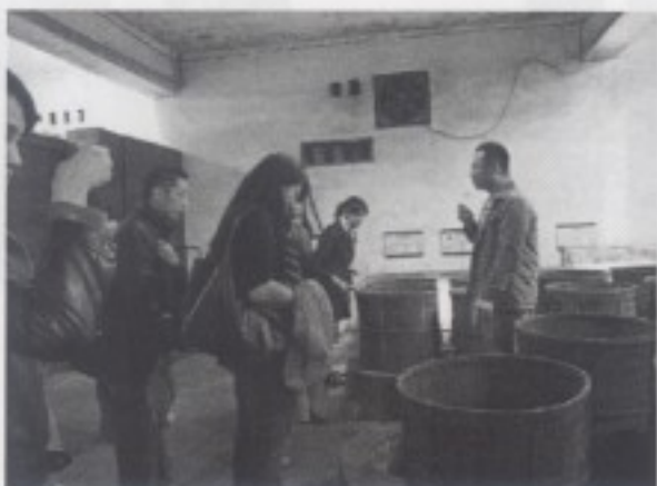
參觀有記茶行，導覽者為有記茶行老闆