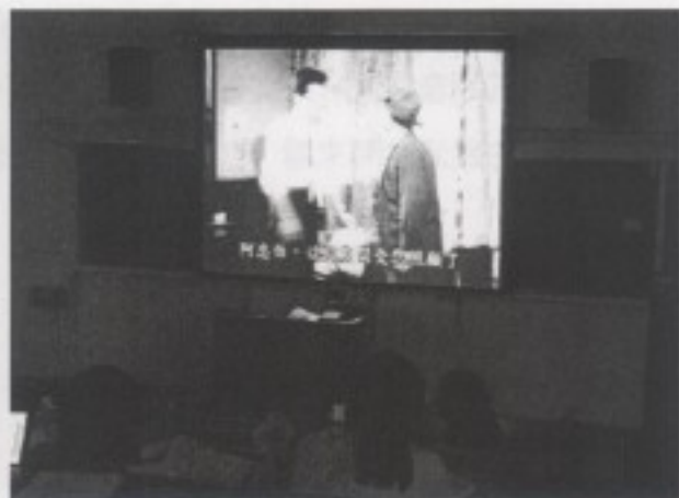
同學觀賞電影舊情綿綿之片段(一)