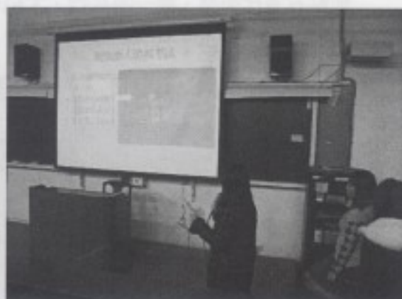
分組同學進行報告(二)—西門町街頭藝人