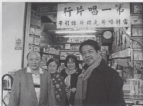
石教授、羅教授拜訪第一唱片行老闆與老闆娘