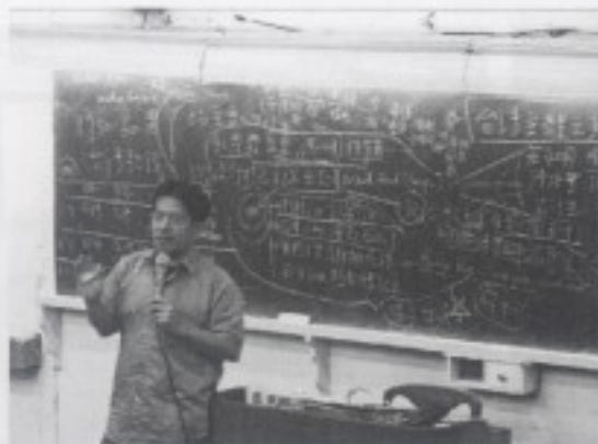
石教授講授台灣的流行音樂發展史