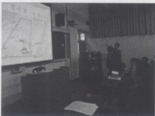
寶斗里音樂文化之現象