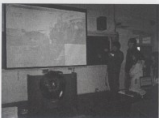
寶斗里音樂文化之現象訪談內容呈現