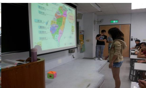
林季良副總經理介紹悠遊卡公司 各組派代表擲骰子決定期末報告行銷地點