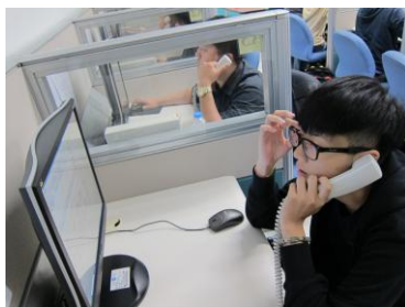
選舉研究中心參訪並實際打電話訪問練習