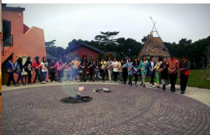
學習用羊齒蕨製作花圈，為參加部落婚禮做準備 以傳統儀式進入部落，祈求平安順利