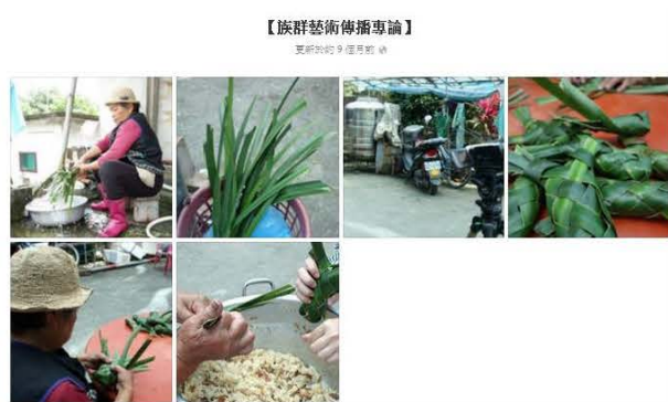
【族群藝術傳播專題】之製作「galivonvon」

中後期隨著學生導讀分享，每個人生活、工作經驗讓不同的主題都有更多的實際案例可以說明，搭配老師適時補充，每週的主題都有不錯的討論與生活結合。