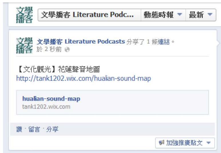
圖四：文學播客連結資訊

臉書上的文學播客粉絲頁即可連結至花蓮聲音地圖(圖四)。畫面簡單明瞭, 以地圖的概念表達, 再以每組主題所代表的文化類型予以一個圖樣, 題目文字加上視覺, 更可以從網頁上看出每一影片的文化主題(圖五)。點選想收看的主题, 在此頁面上即可看上傳到播客系統的视频(圖六)。