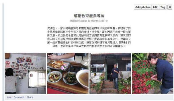
【藝術教育產業導論】之探訪「流流社」

野，其他三組皆拖延了 3-4 週，才正式進入田野。不過在由邱淑宜老師帶領後，各組皆逐漸漸入佳境，與實驗對象和單位深入溝通瞭解，才得以在期末完成播客影片的拍攝。