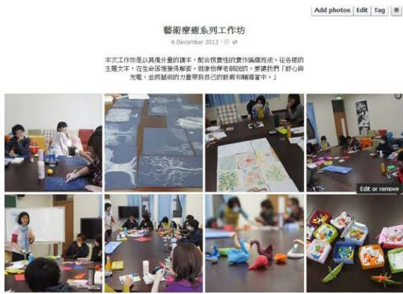
【繪本與生命敘說】之藝術療癒系列工作坊