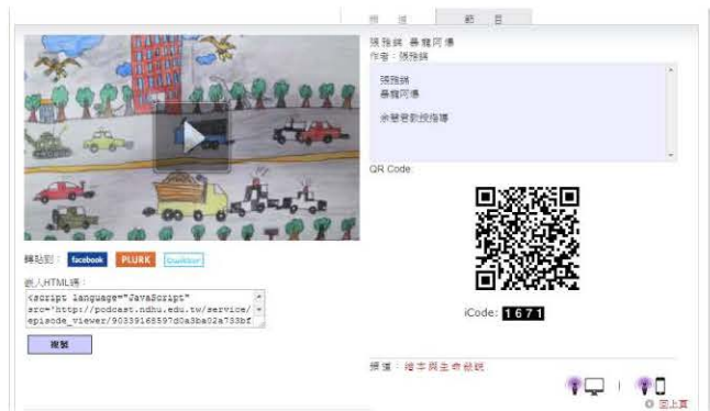
【繪本與生命敘說】學生作品