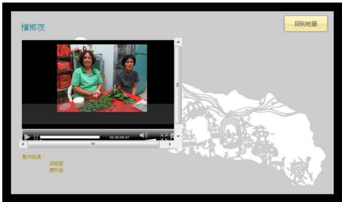
圖六：連結至東華大學播客系統【文化觀光】課程節目：檳榔夜