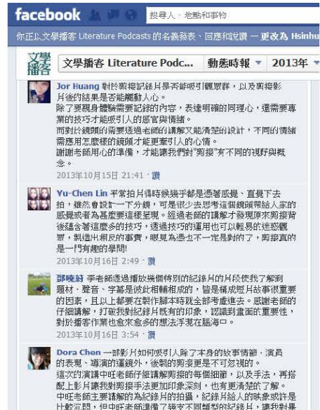
圖三、【文化觀光】：「收音技巧與音樂編輯概念」講座-學生課後心得分享