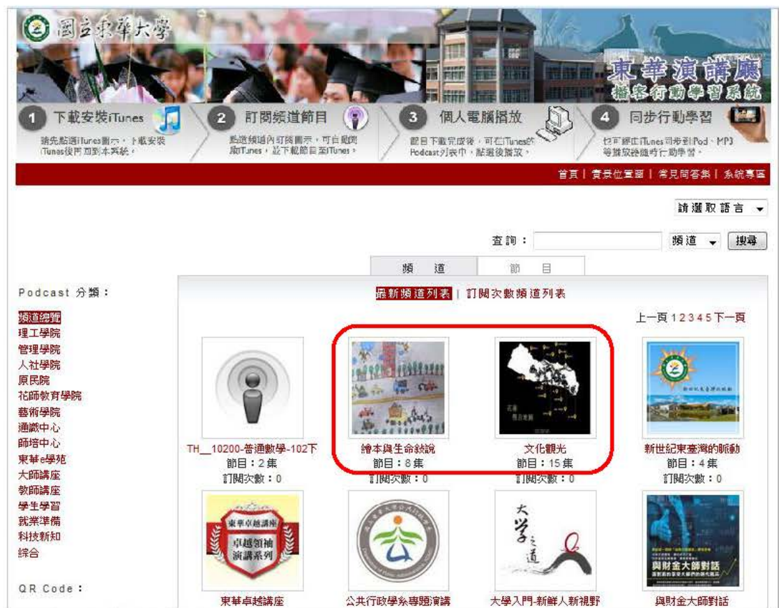
圖一：102-1學期課程【繪本與生命敘說】、【文化觀光】頻道