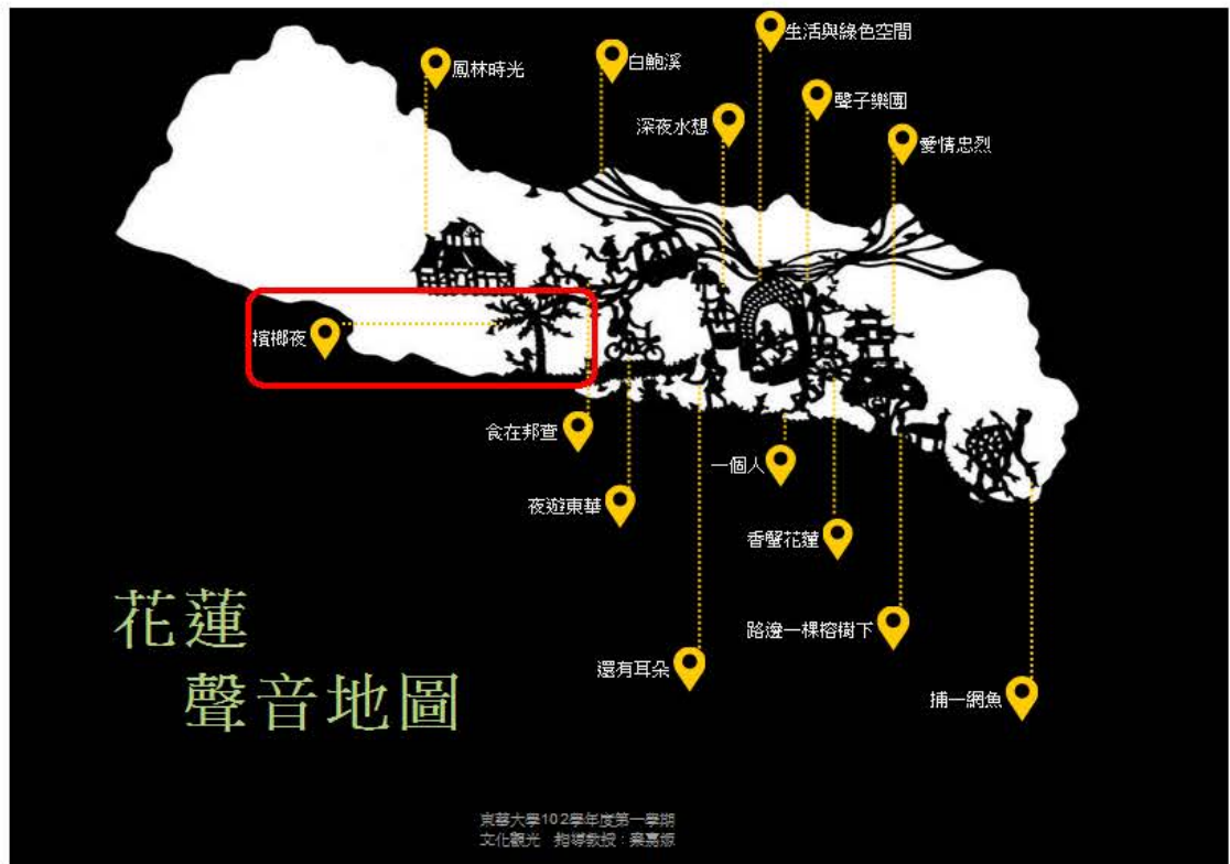
圖五：花蓮聲音地圖網頁視覺