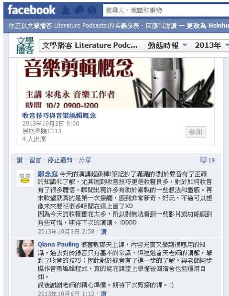
圖二、【文化觀光】：「音樂剪輯概念」講座-學生課後心得分享