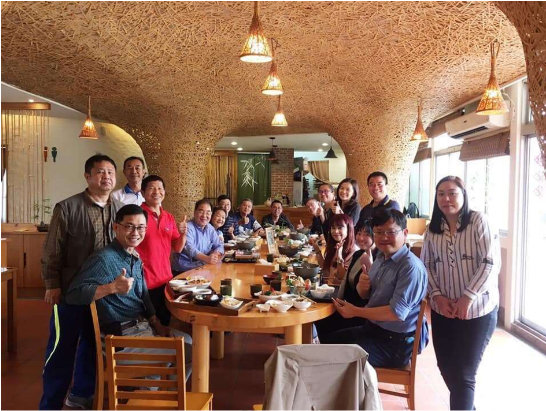
東海大學跨域教師團隊參訪竹山竹青庭創意餐廳