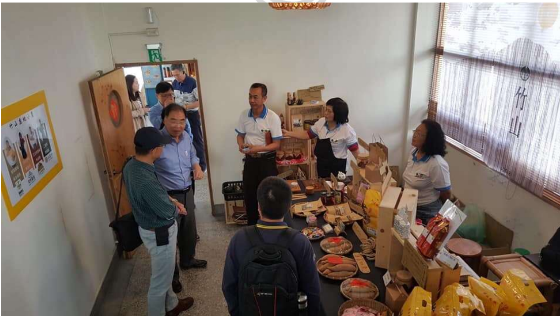
東海大學跨域教師團隊至竹山進行地方創生考察和小農進行交流