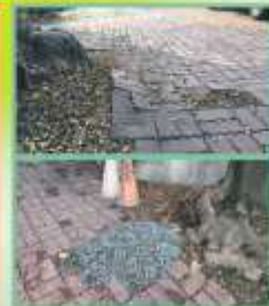
D. 校園運道磚積水長青苔、樹根隆起造成地面凹凸不平。