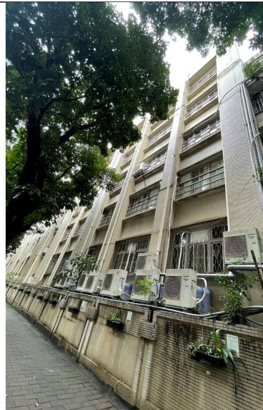
外牆外觀整體規劃(欄杆、冷氣、外排、綠覆蓋)1