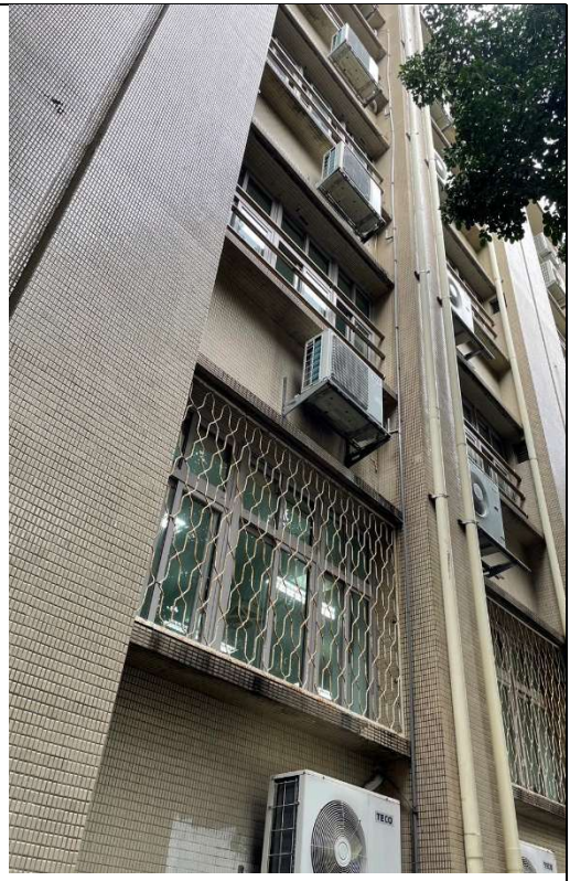
外牆外觀整體規劃(欄杆、冷氣、外排、綠覆蓋)2