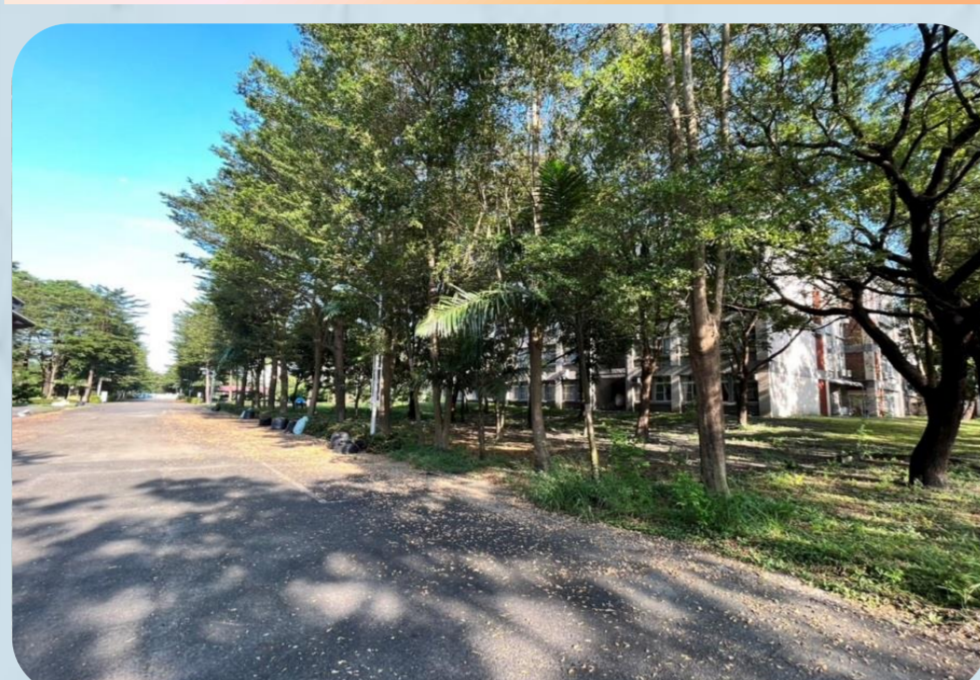
落葉多垃圾袋量大