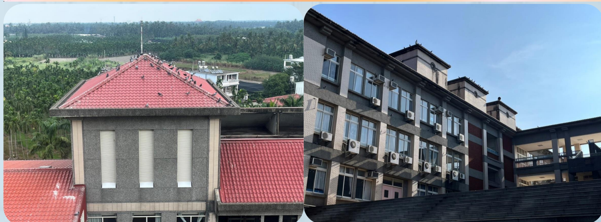
野鴿群聚影響健康