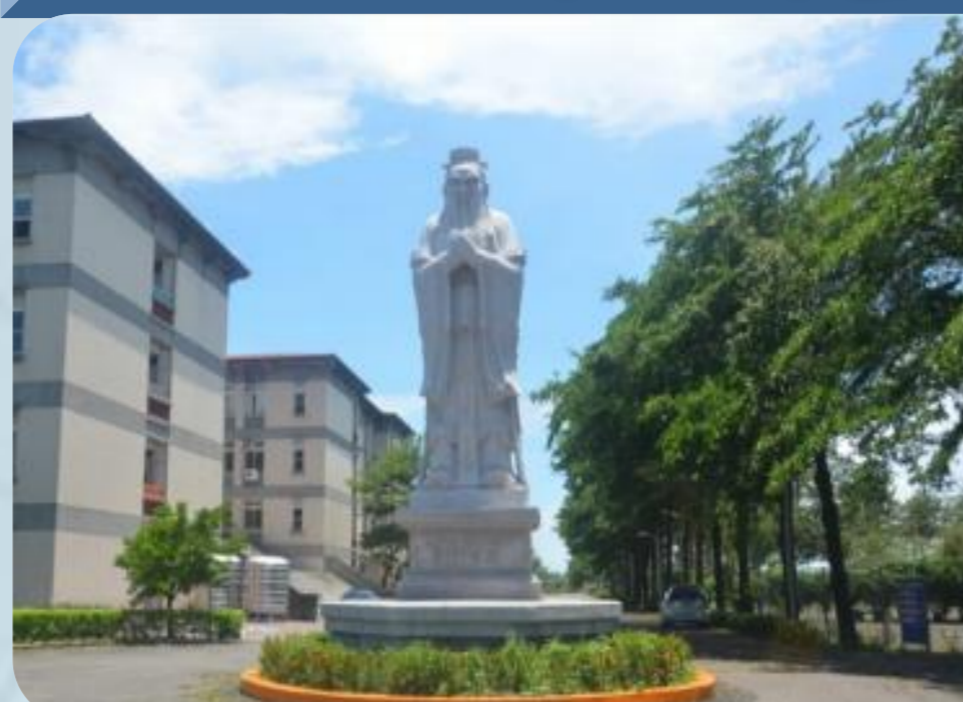
校園廣大生態豐富