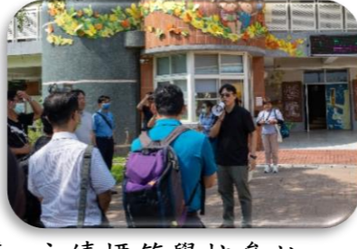
永續標竿學校參訪