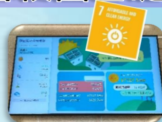
透過 EMS 智慧電表 觀察用電狀況