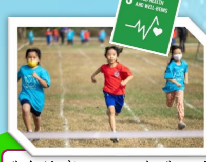
體育競賽，融入建體領域