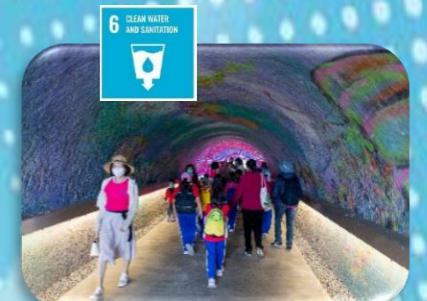
旗津海岸公園戶外教育