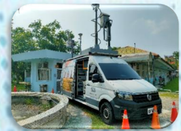
SGS 監測空污與噪音指數