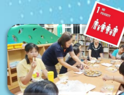
辦理夜光天使弱勢照