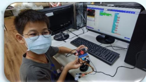
推動 microbit IOT 監控 設備蒐集數據應用課程