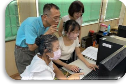
教師專業社群討論