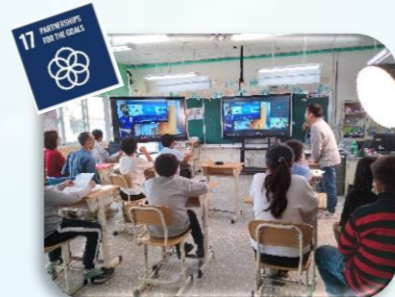
與日本鹿本小學進行國際交流