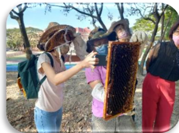
社群教師參訪 推動養蜂教育