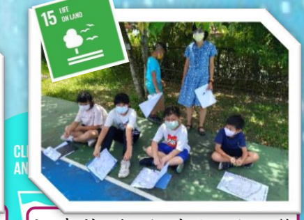
永續營隊-觀察校園生態