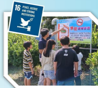
推動無菸校園政策