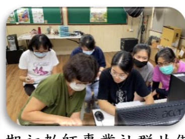
期初教師專業社群共備 討論適合的推動方向