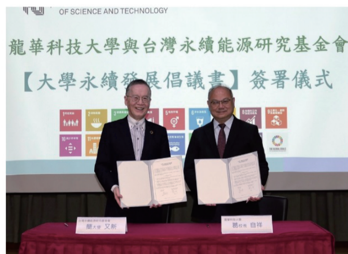
龍華科大與台灣永續能源研究基金會簽署倡議書，攜手推動永續發展。