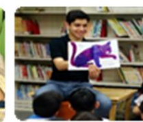
國際志工繪本教學