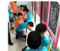
寫信給畫展創作人