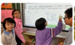
互動式電子白板劃記閱讀重點