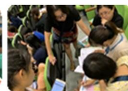
分組討論閱讀策略融入領域教學