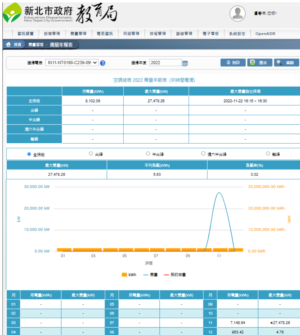
圖一、積穗國小全校2022用電趨勢

在公共區域設置智慧電錶的監控面板，讓學生和教職員工隨時了解能源的使用情況。輔以班級環保尖兵紀錄，提高能源使用的透明度，促進節能的行動。