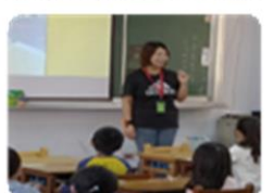
故事志工入班說故事