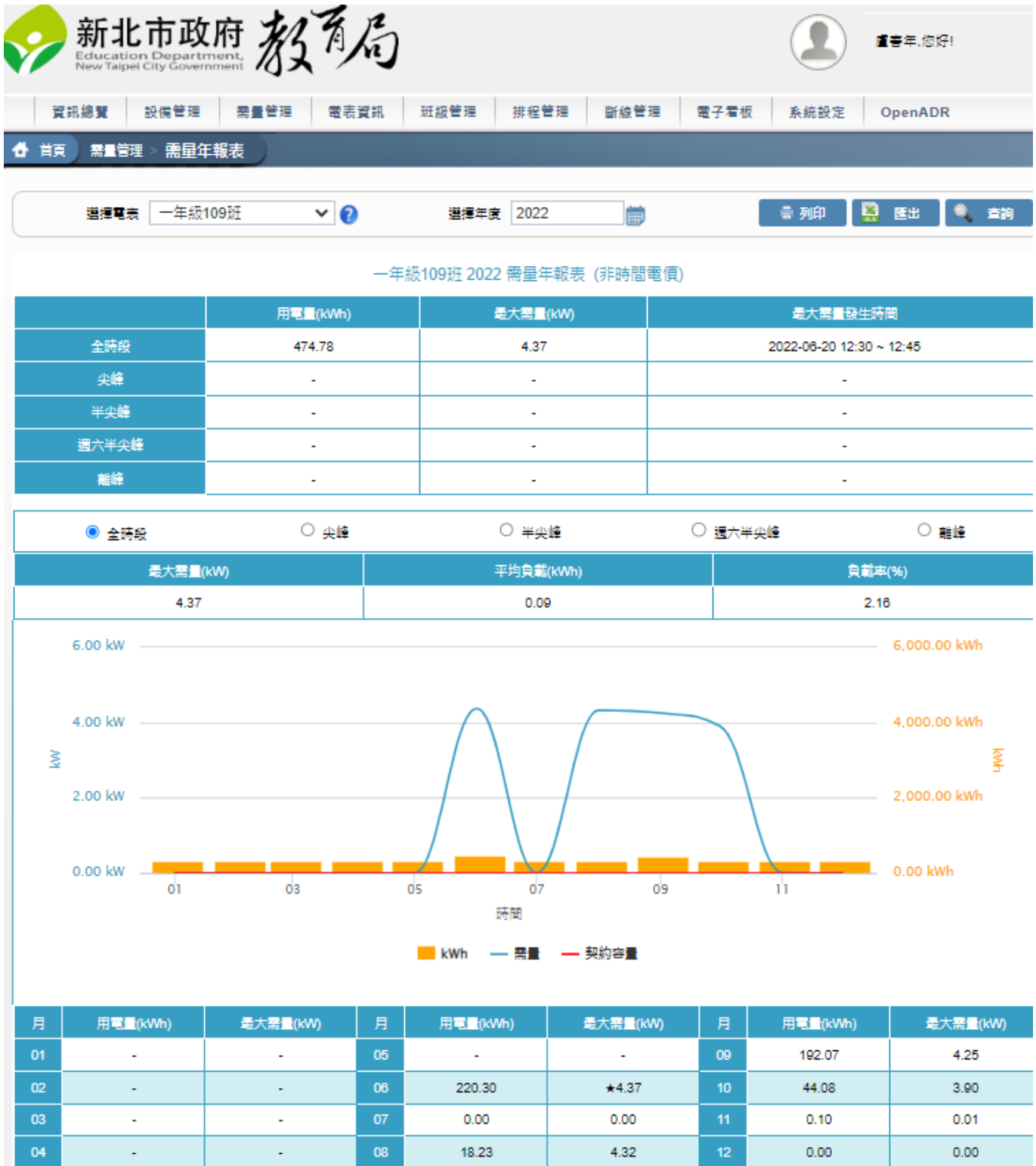
圖二、積穗國小一年九班2022用電趨勢