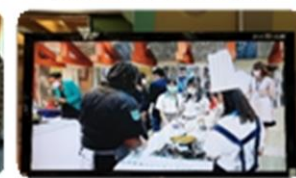
多媒體廣播系統-學生新聞播報