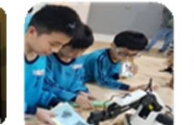
自造中心-科技的圖書館