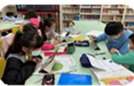
平板結合線上資源搜尋資料