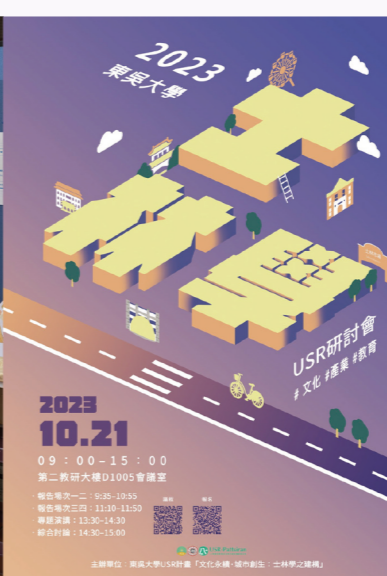
↑ 舉辦士林學研討會