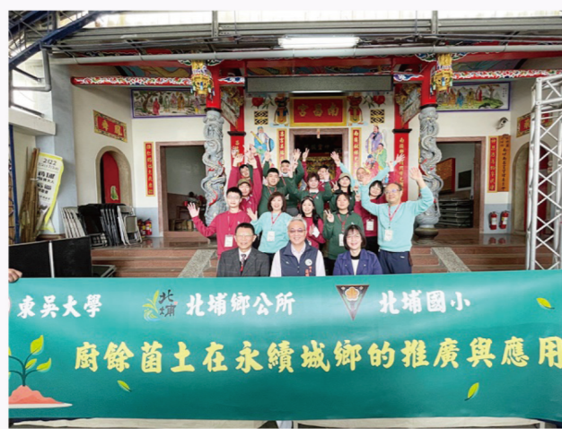
↑ 與北埔鄉公所合作