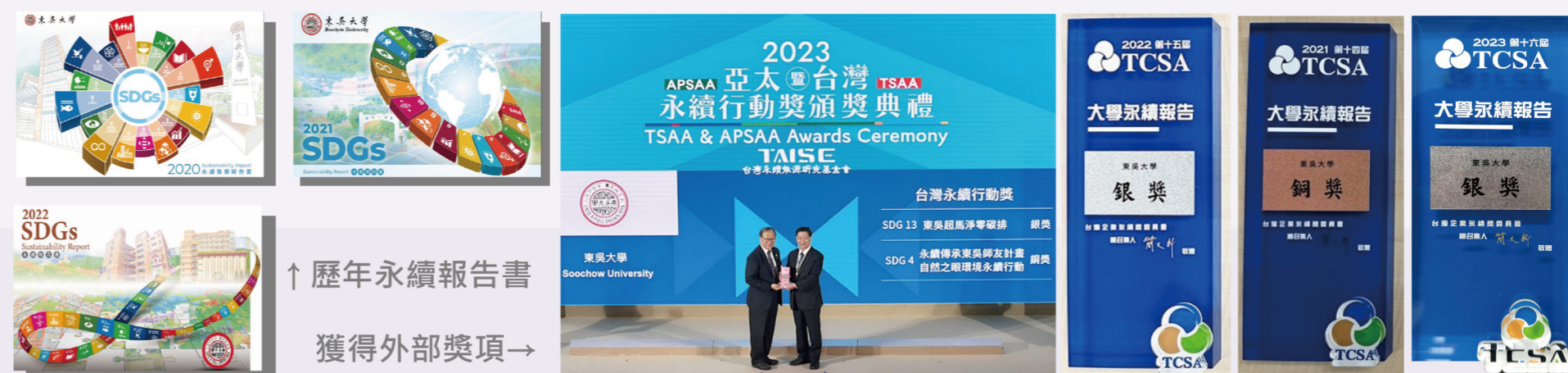
↑ 歷年永續報告書 獲得外部獎項