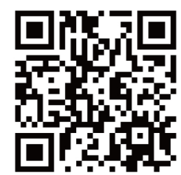
↑ 太陽光電設置展示影片