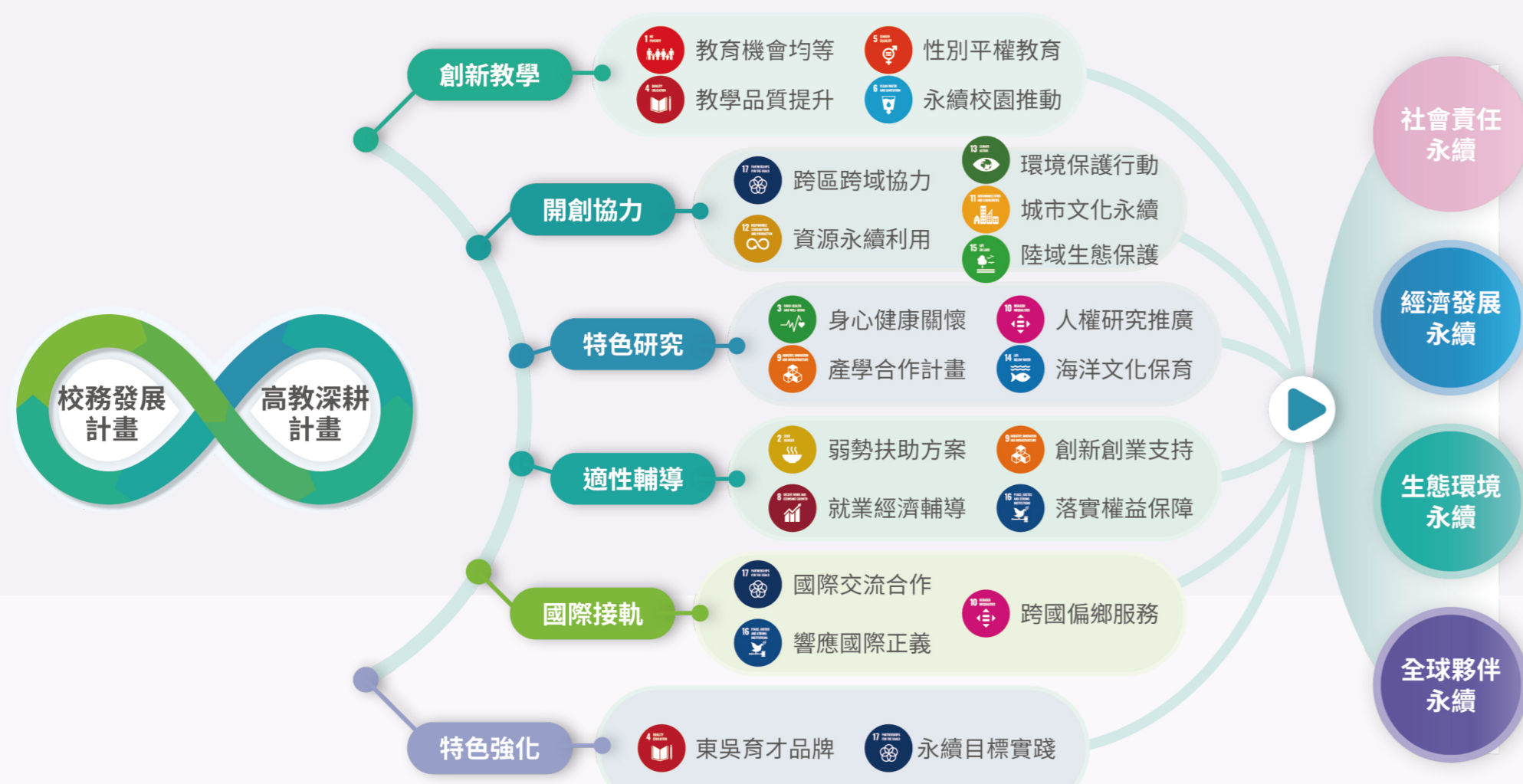
↑ 校務治理結合與永續發展目標