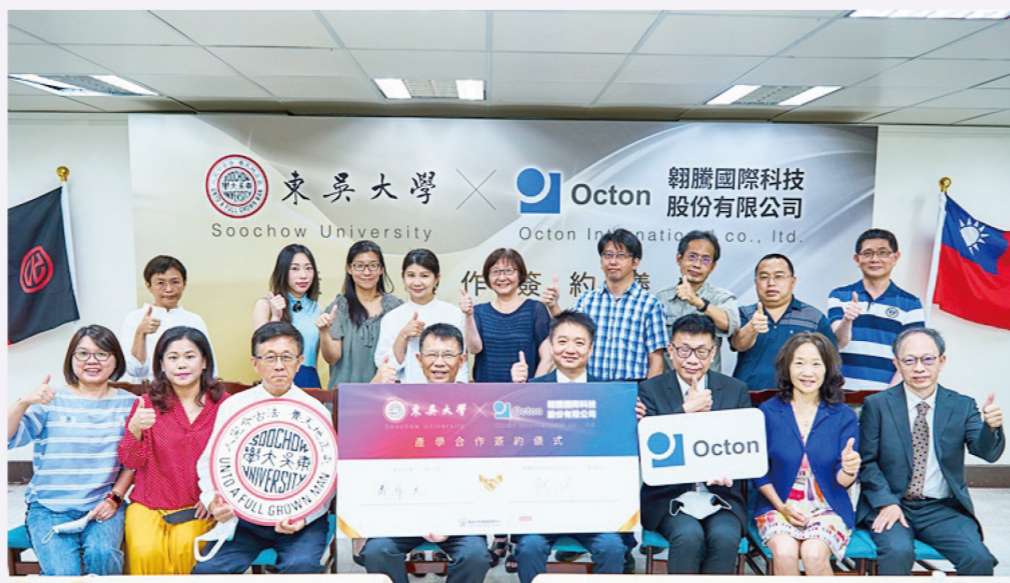
↑ 產學合作簽約儀式