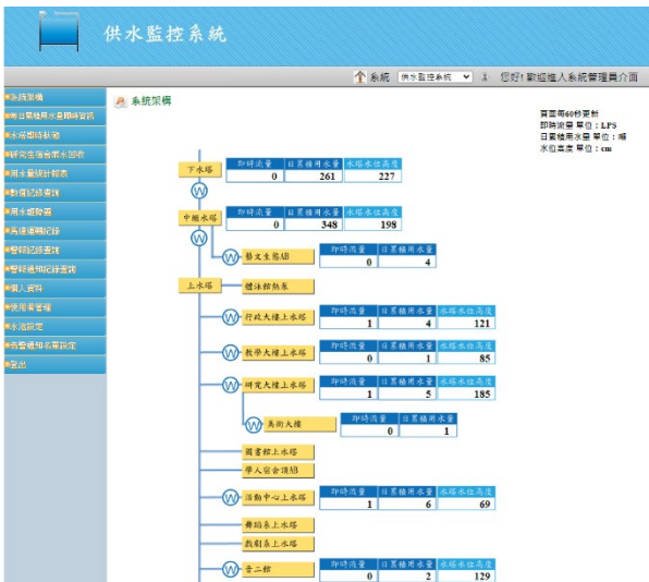
圖5 本校供水監控系統情形。

目前校內仍有使用中央空調的建築物，包含音樂學院一、二館、科技藝術館、圖書館、研究大樓，透過本校建物能源管理系統，依季節及單位使用需求，可進行中央空調、各空調箱、小型送風機及水泵啟停時間之調控，減少能源浪費。另外，本校研究生宿舍及科技藝術館建置有雨水回收系統，供應沖廁及澆灌使用，並將回收量之數據進行紀錄。