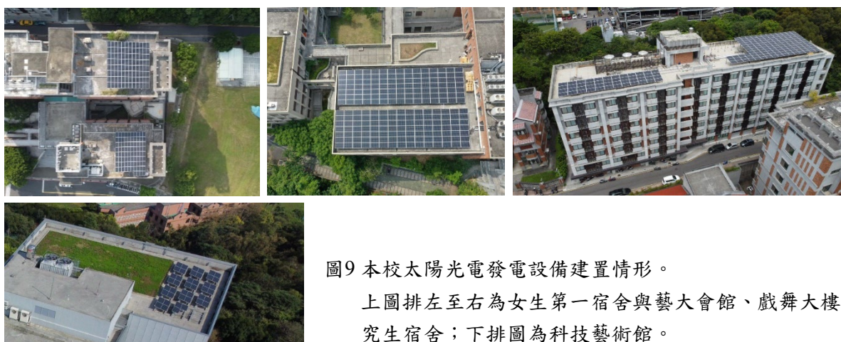
圖9 本校太陽光電發電設備建置情形。

本校太陽光電發電設備設置為依據行政院「太陽光電2年推動計畫」能源政策，開放標租本校建物屋頂平台空間（包含女一舍、藝大會館、研究生宿舍、行政大樓及戲舞大樓，其餘大樓為斜屋頂或平台面積較為崎零，不易設置外掛太陽能板，故不開放設置），提供廠商設置太陽光電發電設備建置及售電予台電，以符合國家能源轉型政策，109年6月19日完成招租，由挺新能源股份有限公司得標，後續於11月17日由本校校園規劃小組同意設置於女一舍、藝大會館、研究生宿舍及戲舞大樓頂樓平台，設置容量總計為189.15kWp，回饋金百分比為6.5%，於110年6月15日全數安裝及併聯完成，110年8月9日獲台電公司正式核備售電，由承租廠商定期維護，另科技藝術館於110年由本校自行建置太陽光電發電設備，建置容量13.975kWp，由本校自行維護。