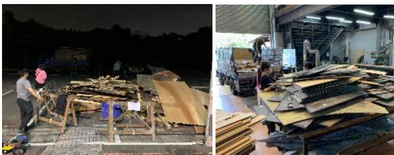
圖4 教學目的產生的待清運垃圾（左）與可再利用材料（右）。