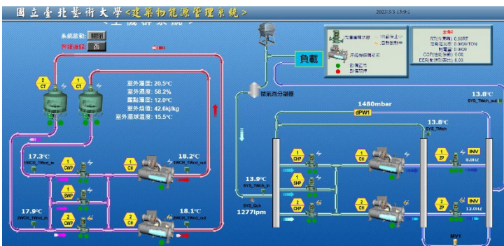
圖7 本校 BEMS 平台情形。