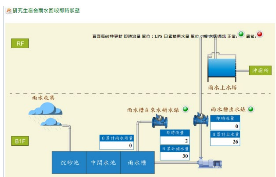
圖8 本校雨水回收數據平台情形。