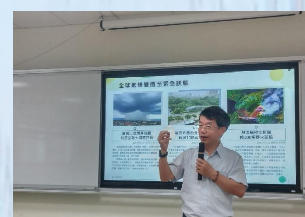
教師研習-永續校園