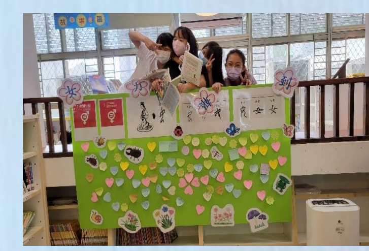
主題書展-性別友善牆