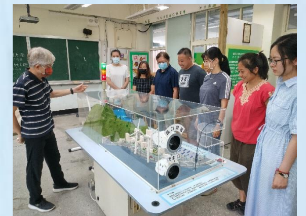
輔導諮詢-萬芳能源島