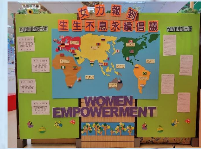
主題書展-永續倡議