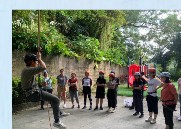
教師研習-攀樹課程