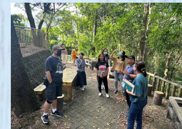
教師研習-陸域生態