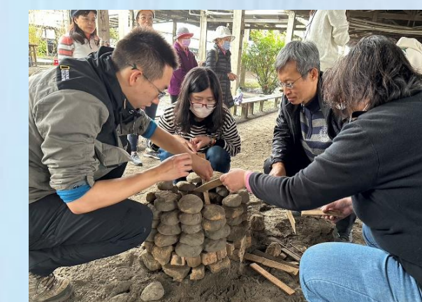
環教參訪 食農體驗活動