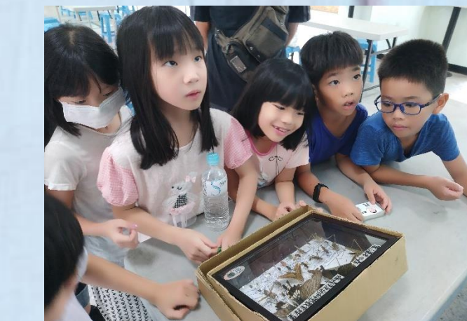
生態共好農法 -標本的故事