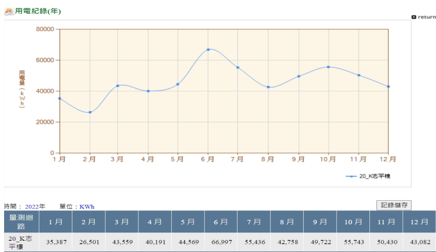
圖二志平樓用電紀錄